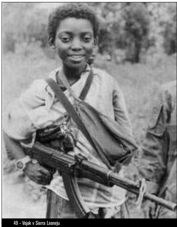
49 - Vojak v Sierra Leoneju

poraženih, lahko to v sebi visoko racionalno vodenje gospodarstva ostane nespremenjeno. Resda na tržiščih nasilja ne more priti do povišanja družbenega bogastva, lahko pa se vpeljejo novi produkcijski odnosi - tudi "modernizacija".