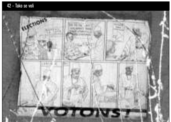
42 - Tako se voli