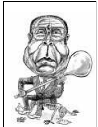
47 - Robert Mugabe (Zimbabve)