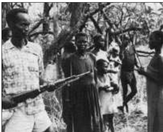
44 - Sudanski uporniki