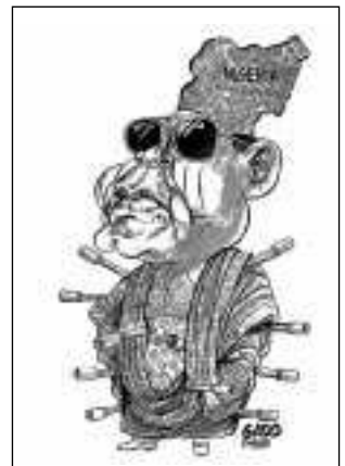
48 - Abacha (Nigerija)