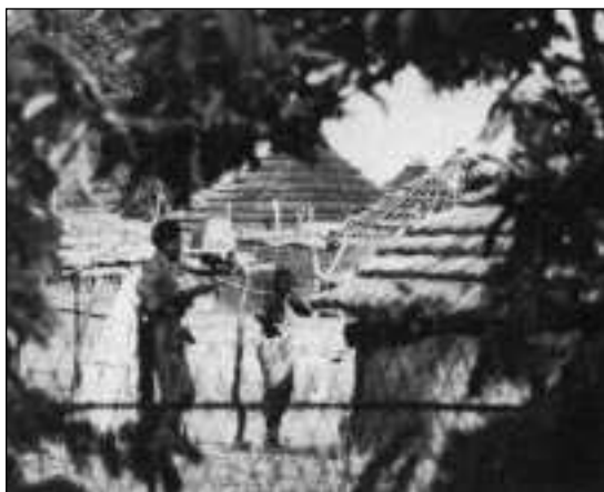
45 - Vojna na podeželju

redko kdaj strateško načrtovane, hitro eskalirajo in se končajo s klanjem ljudi, ki so si bili nekoč blizu. Poročila iz Ruande in tudi iz Bosne postavljajo v ospredje pomen radijske in televizijske propagande. V Ruandi je imela radijska postaja, postavljena s sredstvi za razvojno pomoč, vlogo ustvarjalke in ojačevalke strahu, ki je nato izzvala pokole (Meillassoux in Behrend, 1994).