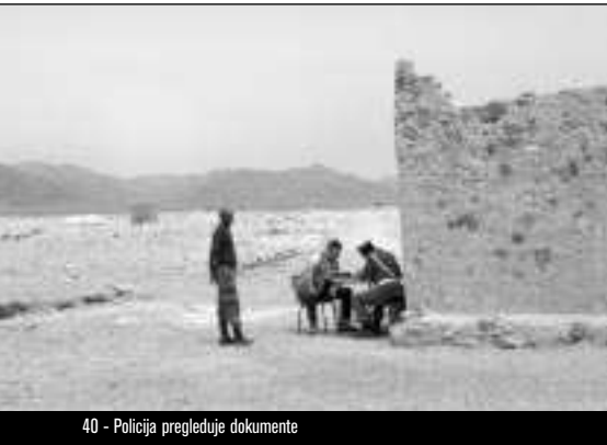
40 - Policija pregleduje dokumente

Izraba drugih ljudi za instrumente nasilja, strateško nasilje, je naslednji korak. V tem primeru lahko akter na fronti spet vključi močne instinktivne procese, celo deluje lahko, kot če bi bil v transu. Primera za to sta trans Berserkerjev, kar je element germanskega vodenja vojne, ali trans pri malo kasneje obravnavanih Basedah. Resnični akter nasilja vendarle ni bojevnik, ki se povsem osredotoči na motorični cilj in vsaj nekaj trenutkov ni sposoben