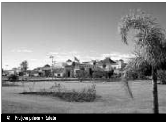
41 - Kraljeva palača v Rabatu