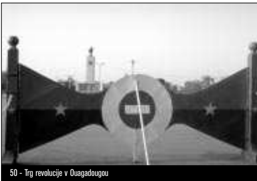
50 - Trg revolucije v Ouagadougou