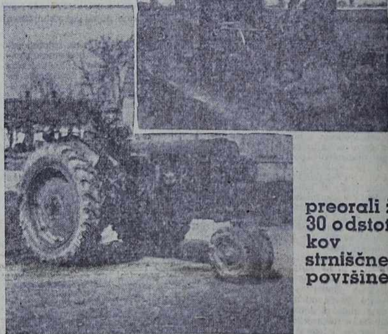
preorali že 30 odstotkov strniščne površine