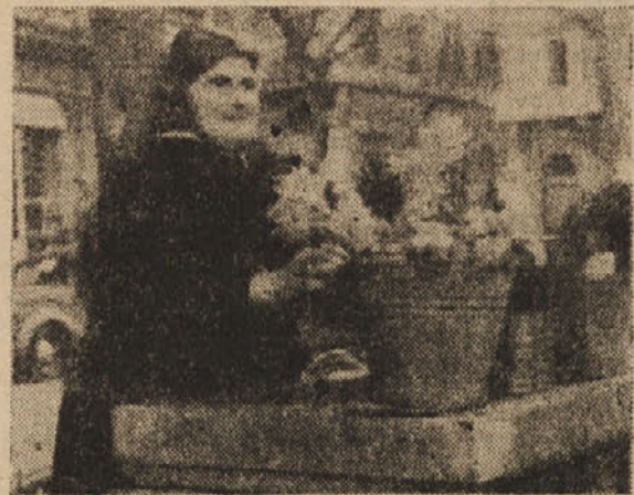
Pri Manzovki pod Staro šrangjo

Toda enega se je Manzovka navadila. Pred 30 leti je preklela na,