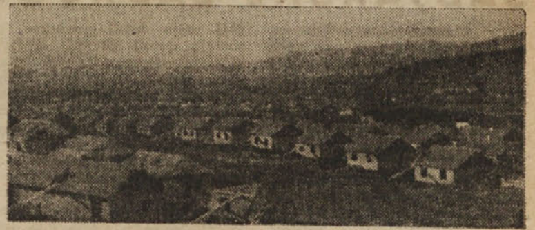
NOVO SVRAKINO SELO NA HRVATSKEM

Za obnovo v Istri je bil določen kredit 500 milijonov dinarjev. Oč tega je bilo oddeljenih samo Reki okrog 100 milijonov.