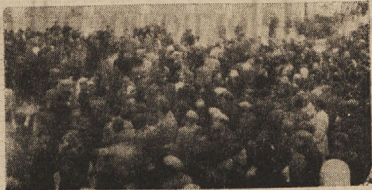
DEMONSTRACIJA TRZASKIH ANTIFASISTOV PRED OKUPACIJSKO OBLASTJO ZARADI BOMBNEGA ATENTATA NA CERMELJEV KROZEK

je le z novimi obeti pomagal iz zadrege. Policija pa ne bi bila vredna svojega kolonialnega slovesa, ko se ne bi znova spozabila nasproti mirno se razhajajoči množici in drugim mimoidočim. Na Korzu in na Goidonijevem trgu je ponovno navalila nanje. Medtem pa so drugod po mestu fašistične