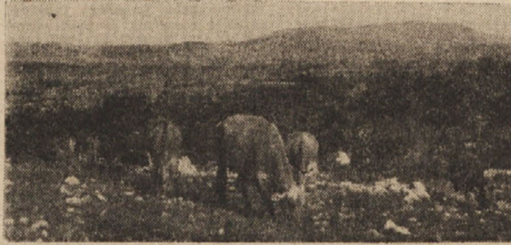
NA KRASKEM PASNIKU

Junica telca približno 3 stote, telca pa 2 stota. Torej imamo v hlevu 25 stotov žive teže. Ako računamo, da porabimo za vsakih 100 kg žive teže dnevno po 2,5 kg krme, potrebujemo za 2500 kg žive teže po 72,5 kg krme dnevno. Vze, mimo, da bomo imeli živino pri