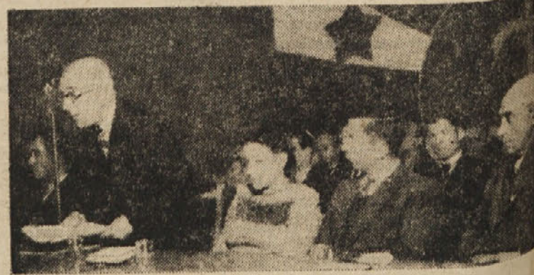
PREDSLEDSTVO KONGRESA MESTNE SIAU

500 NOVIH POLICISTOV je bilo v soboto vključenih v tržaško civilno policijo, ki naj bi po licemerskih izjavah višjega častnika za civilne zadeve predstavljala poroka temeljnega tržaškega prebivalstva, da bi živelo v miru. Nj potekel se niti teden dni, odkar je prav to tržaško prebivalstvo na lastni koži čutilo pendreke te policije in doživelo pri Sv. Alojziju zadnje teroristično nastilje njenih fašističnih varovancev.