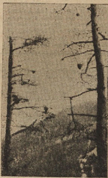
BOROV PRELEC UNICIL VES NASAD

V popolni obliki (kot metulj se pojavi borov prelec v mesecu juliju. Podnevji se metuljček skriva, v večernih urah in ponoči leta. V ostalem je prelec neokreten in ne