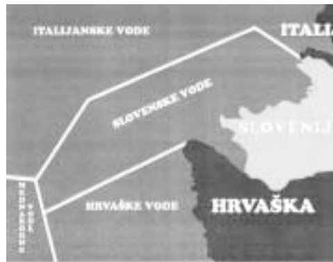
Sedanje stanje, kot ga določata Temeljna ustavna listina in Zakon o razglasitvi zaščitne ekološke cone in epikontinentalnem pasu Republike Slovenije, Uradni list Republike Slovenije 93/05.

3. AS bo v „najboljšem“ primeru Sloveniji omogočil „služnost“ oz.