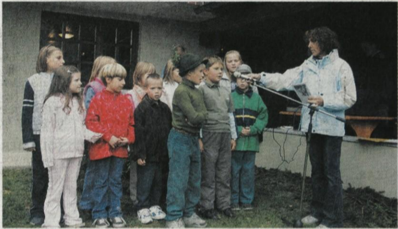
Lovska družina Sela dobro sodeluje tudi s podružnično osnovno šolo Sela, zato so otroci z veseljem nastopili tudi ob zlatem lovskem jubileju.