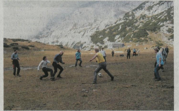
Igra je bila dinamična.

Tradicionalna, že šestindvajseta nogometna tekma na nadmorski višini 1800 metrov je bila v nedeljo, 3. oktobra, na Korošici. Pristnih Štajercer je bilo samo pet in pristni Štajerci samo trije. Zato so dobili v pomoč še eno Kranjico in dva Kranjca, vendar je bil končni rezultat, kljub močnemu odporu, 3:1 za ekipo Kranjske. Zato pa so »poraženci« obljubili »revanš« prihodnje leto, na prvo nedeljo v oktobru.