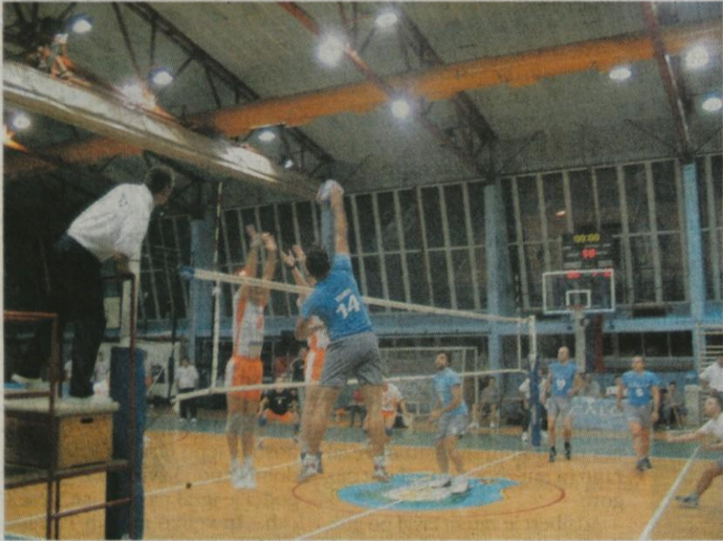
Prizor s tekme prvega kroga med Calcitom in Bledom.

Sicer pa v kamniškem klubu še naprej vpisujejo najmlajše igralce in igralke (1.90 in mlajši). Za informacije se lahko obrnete na tel.: 041/760-469 Aco.