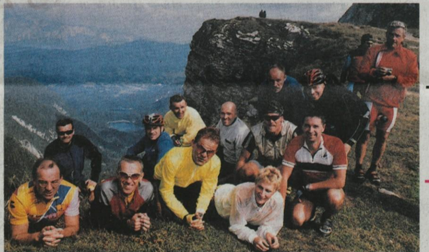
Za nami je 12-kilometrski vzpon na Mangartsko sedlo!