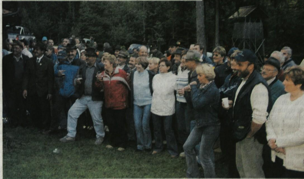
... njihovo muziciranje je ogrelo in navdušilo številne obiskovalce.