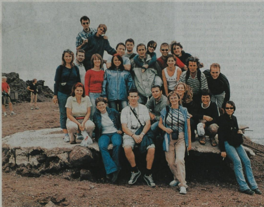
Cantemusovci na vrhu Vezuva.