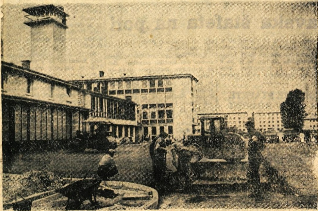
KRANJ - Severni del Kranja iz dneva v dan spreminja podoba. Ob novi sodobni pekarni, gasilskem domu, bodo kmalu uredili tudi okolico, novo cesto itd. Zatem pa se bo pridružila še stolpnica

In res, pogovorili so se o dopustih. Toda naslednji dan, ko sem zvedel, da prejme Marko ob koncu meseca v kuverti toliko kot štirje drugi delavci, da ima zagotovljene še stalne mesečne honorarje, da prejema posebne dodatke, da... In zato so se po-šo govorili o dopustih. - Obrazi so pač različni! - K. M.