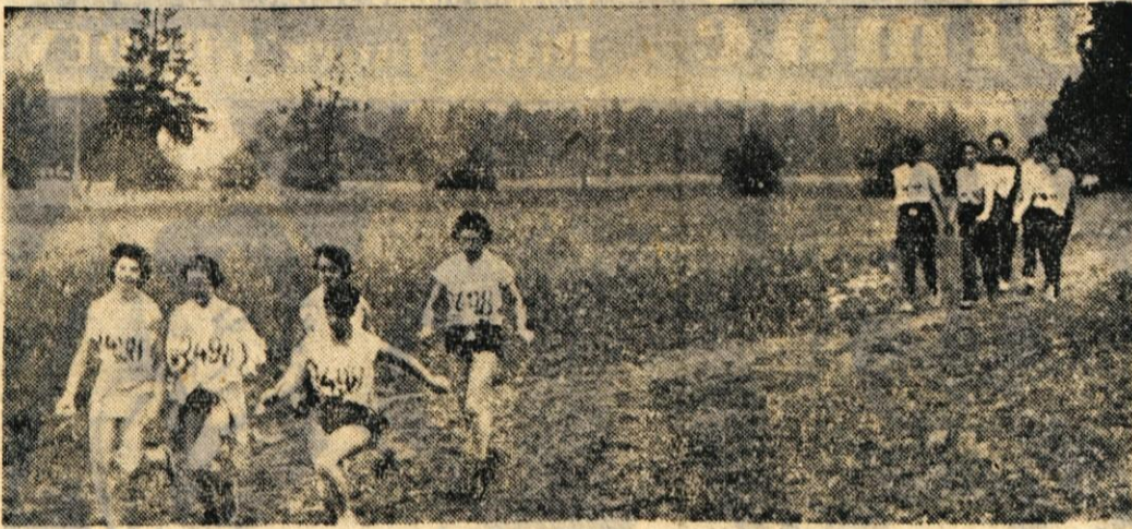
Včeraj je bil v Ljubljani 6. pohod »Ob žici«

izgubljenih podaj in neuspešnih metov Kranjčanov so Splitčani taktično zelo dobro igro pretvorili v razliko v svojo korist. V šestih minutah so dosegli 12 košev, Kranjčani pa le 2. Domači so hoteli to nekako zajeziti z menjavami, ki pa niso bile najboljše rešitve situacije. Potrebno bilo (vendar že prej) umiriti igro in v napadu obdržati žogo mnogo dlje kot so jo. V zadnjih minutah so gostje razliko deset točk povečali na 16. — L. S.