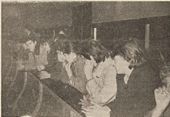
Proslava ob dnevu republike v Šeškovem domu — tokrat balkon. Žal se je proslave udeležilo le okoli 50 odraslih (in približno toliko mladine), kar meče slabo luč na prebivavce Kočevja