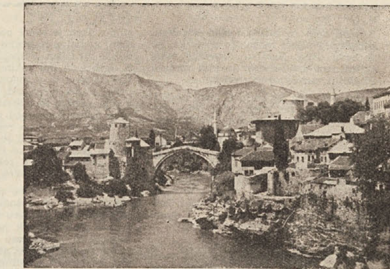
MOSTAR IN NJEGOV ZNAMENITI MOST NAD NERETVO

Po tem moralnem nauku se odpravimo na postajo, tako da nas med potjo še ujame silovita poletna ploha, poiščemo prtljago, kupimo vozovnice in sedemo v avtobus. Pristopi sprevodnik: »Molim, rezervacije.« Debelo ga pogledamo, saj se nam o rezervacijah niti ne sanja. Pove nam, da moramo plačati rezervacije pri blagajni na postaji. S Filipom se ponovno za-