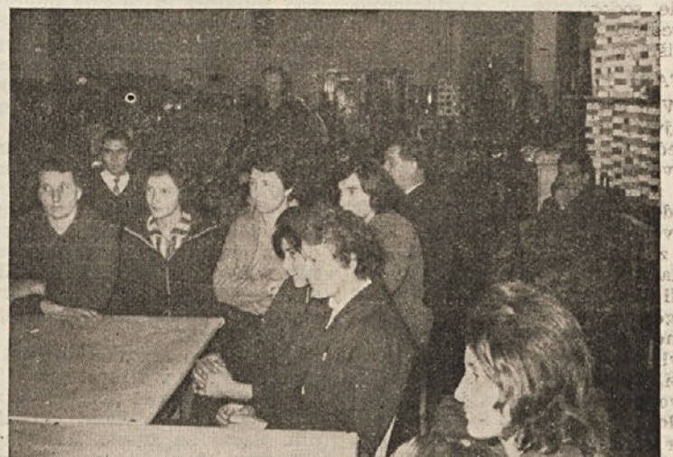
Kakor v večini naših kolektivov so tudi v ČZP Kočevski tisk v Kočevju z malo interno proslavo počastili dan republike 29. november. (Na sliki del članov kolektiva med proslavo)