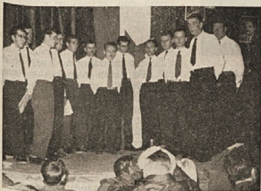
KUD IVAN VRTAČNIK JE KONČNO LE USPELO OŽIVITI PEVSKI ZBOR, KI JE NA PROSLAVI KAR DOBRO ZAPEL

Vse te pomanjkljivosti pa bodo odstranjene predvidoma že do novega leta, ko bo zgrajen in dan v pogon novi rezervoar na pobočju Mestnega vrha. Novi rezervoar je že povezan z mestom z 200 mm cevovodom, ki gre mimo Podgorške ulice. Ko bo voda stekla iz novega rezervoarja po tem cevovodu, bo imelo področje Salka vasi, Rudnika in Cvišlerjev dovolj vode.