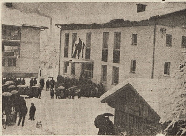
RIBNICA JE Z NOVO, MODERNO OPREMLJENO POŠTO VELIKO PRIDOBILA

Občinski ljudski odbor je nadalje sklenil še, da je zaradi izboljšanja na področju blagovnega prometa, spoštovanja zakonskih predpisov in zadovoljitve potreb potrošnikov nujno še bolj poostriti kontrolo, se pravi, še bolj poživiti inšpekcijsko službo.