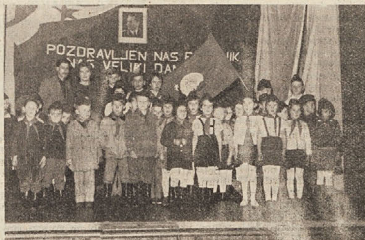
Na proslavi ob dnevu republike so v Sodražici sprejeli cicibane v pionirsko organizacijo