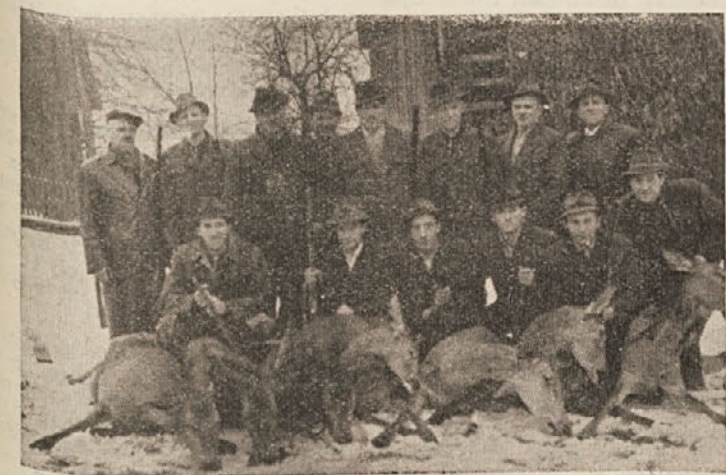
Dolenjevaški jagri in njihove žrtve. (Glej članek na 10. strani)

To pa verjetno ni zadnja »domislica« operaterja, saj je deslej kincobiskovavce že večkrat »prijetno« presenetil. — Morda pa bi bil le že čas, da preneha s takimi presenečenji. P-c