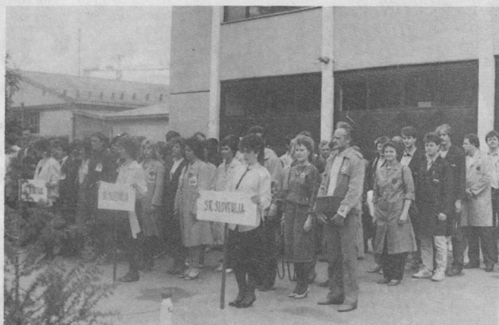
Takmičari u Kanjiži