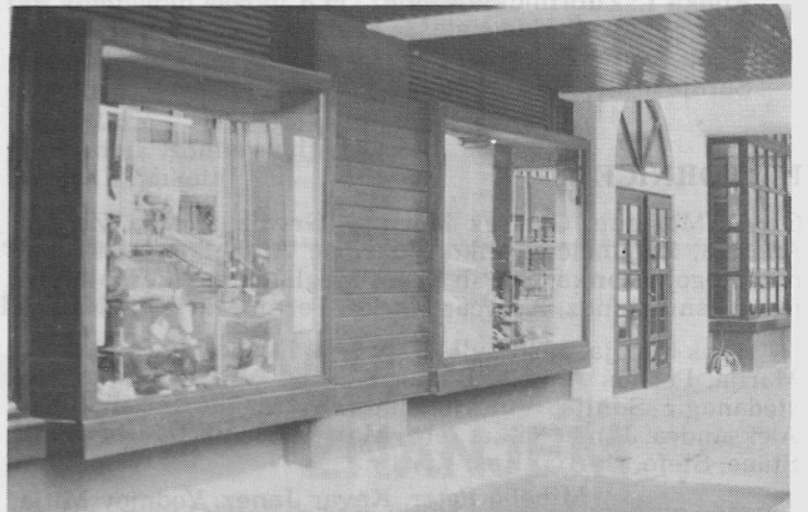
Pogled na poslovnicu Hrastnik

Hrastnik ima 11.400 stanovnika. Trgovine cipela ovde imaju i Planika i Astra a Borovo je svoju nedavno zatvorilo. Godišnje naše radnice prodaju približno 14.000 pari cipela. Kupci, doduše, negoduju zbog visokih cena pa zato prodavac mora da zna da savetuje da bi se cipela preselila iz prodavnice ka potrošaču.