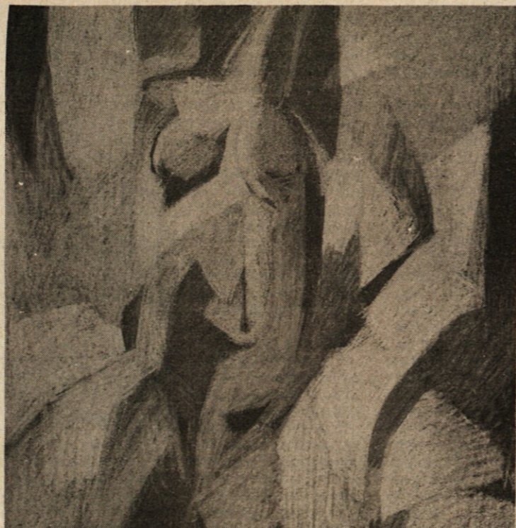
JOŽE KUMER: Akt (pastel na papirju)

Nekateri pravijo, da sem pesnik. Kako žalijo harmonijo Lepote. Jaz sem po tej melodiji le spraševal. Nekateri pravijo, da sem učitelj. Komu? O kako žalijo modrost mravelj in čebel, roč in ptic. Jaz sem jih le spraševal. Nekateri me barvajo kakor plot, ki ogradi notranjost z rdečo kakor plot, ki ogradi notranjost z rdečo, modro ali belo. Že prva rosa žalitev je zmila. In so me nekateri izvolili, da bi pisal zakone, komu? Soncu? Žalosti, radosti tvoji? Smrti? In ko so govorili, po kaj so prišli, so pozabili, da so v svetišču življenja.