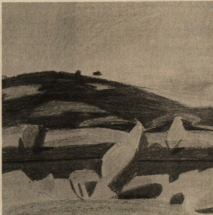
JOŽE KUMER: Skica (pastel na papirju)

In nikoli ne vemo, čemu smo se zbudili in kdaj nam bo usojena vrnitev.