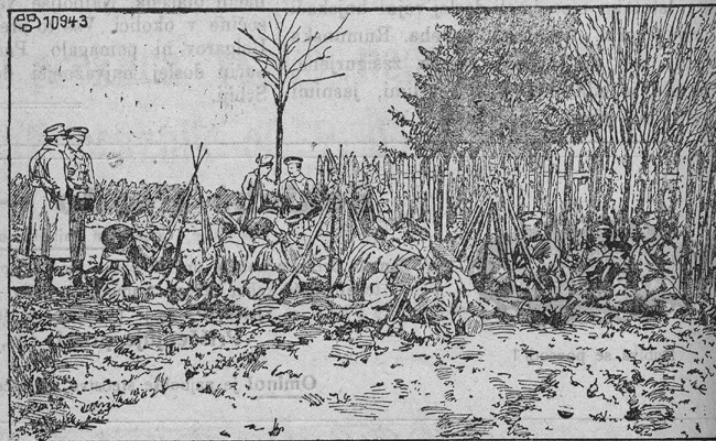
Russische Infanterie während der Rast

Ali si se na „Štajerca“ že naročil? Ako ne, stori to takoj!