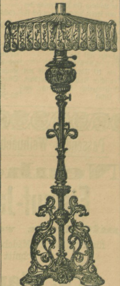
Ständer-Lampe mit Spitzenschirm.

Einsatz mit Brenner von unten anzündbar, regulirbar und auslöschbar.