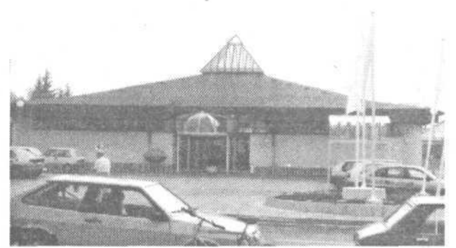
ZA VAŠE POLJE, DOM IN VRT - vse na enem mestu!

SEMENARNA LJUBLJANA ODPRLA NA DOLENJSKI CESTI