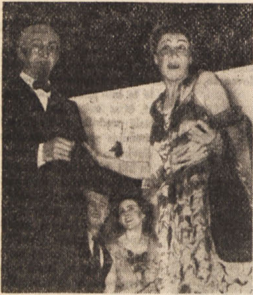
Prizor iz spevoigre „Studentje smo“. Nadaljnje slike bomo objavili v slikovni prilogi.

Lahko trdimo, da je bila nedeljska prireditev Slovenske prosvetne zveze v Borovljah navkljub mnogim oviram in težočam uspešna v vsakem oziru, od pevskega koncerta moških in mešanih pevskih zborov SPZ mimo posrečene scenarije ter dobro izbranih kostumov in mask do dovršenega nastopa jeseniškega baleta in orkestra ter igralske skupine z Brnce. Zato se upravičeno veselimo nadaljnjih uprizoritev, ki so predvidene tako pri nas na Koroškem kakor tudi v Sloveniji.