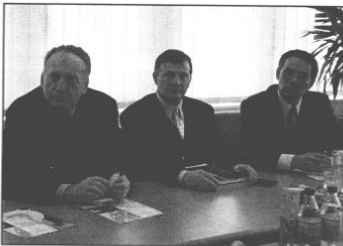
Predstavniki mesta Split in gospodarstveniki iz Šaleško-savinjskega področja so sklenili nekaj konkretnih dogovorov o nadaljnjem sodelovanju med mesti.