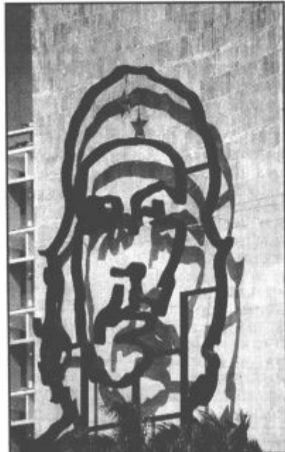
Che Guevara - relief, velik kot blok. Pravijo, da bi bilo na Kubi vse drugače, če bi bil še živ.

Najpomembnejša ptica je tocororo, ptič rdeče, bele in modre barve, enake kot v zastavi. Bruto dohodek na prebivalca znaša 1500 dolarjev. Najpomembnejši datum v novejši zgodovini otoka je 1. januar, ki je za Kubance veliko več kot zgolj začetek novega leta. To je novih 365 dni pod Castrovim sistemom, 365 dni revolucije, 365 novih dni upanja na boljše čase in tako je že 40 let. 1. januarja so praznovali 40. obletnico od padca skorumpiranega režima Batista in prihoda Fidela in njegovih barbudov. Kuba se ponaša z dolgo in bogato zgodovino, kar pričajo tudi fantastična mesta - Havana, Santa Clara, Trinidad, Santiago in seveda ostali. Prvotni prebivalci so Ciboni, potem pa naj bi v začetku naše