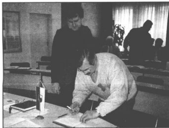
Svetniki so se podpisali pod izjavo, da bodo vestno opravljali delo.