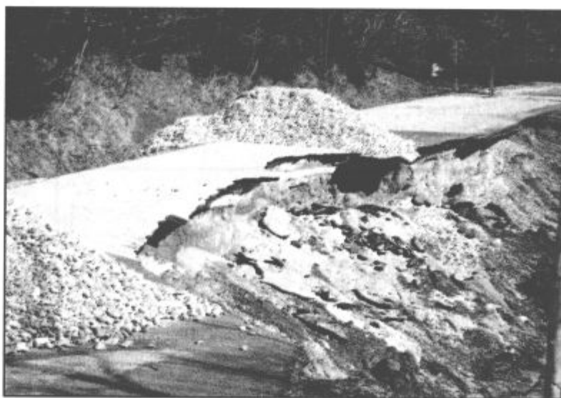
Cesta v zgornjih Ravnah konec tedna. Po zagotovilih odgovornih bo kmalu drugačna.

bi cesto vsaj začasno že uredili za lokalni promet, če bi bile vremenske razmere ugodnejše. Izvajalca so že izbrali in se z njim vse potrebno tudi dogovorili. "Zadeva ni tako enostavna, kot morda menijo krajani. Potreben je projekt za obnovo,