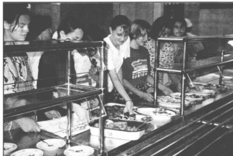
Ravnatelj osnovnih šol so na srečanju poudarili, da so na Šolskem centru dokaj dobre možnosti za izobraževanje fantov, manjkajo pa programi, namenjeni izobraževanju deklet.