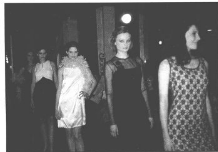
Delček modne revije je bil namenjen večernim toaletam...