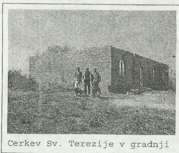
Cerkev Sv. Terezije v gradnji