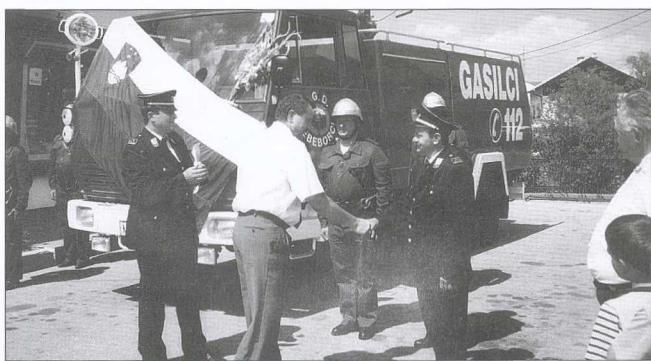
NOVA AVTOCISTERNA ZA SEBEBORSKE GASILCE

V članskih vrstah so bili najuspešnejši gasilci iz Fokovec, Središča in Moravskih Toplic ter gasilke iz Sela in Bogojine. Med mladinci so prvo mesto osvojili fantje iz PGD Sebeborci pred PGD Tešanovci in PGD Vučja Gomila, med mladinkami pa prav tako iz Sebeborci. In še pionirski kategoriji: Martjanci, Moravske Toplice in Sebeborci pri fantih ter Tešanovci pri deklicah.