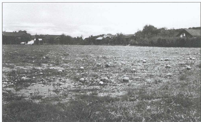
Toča je najbolj prizadela k. o. Sebeborci

Skupno ocenjena škoda zaradi naravnih nesreč v kmetijstvu (pozeba, suša, toča) v letu 1997 v občini Moravske Toplice je okrog 700 milijonov tolarjev.