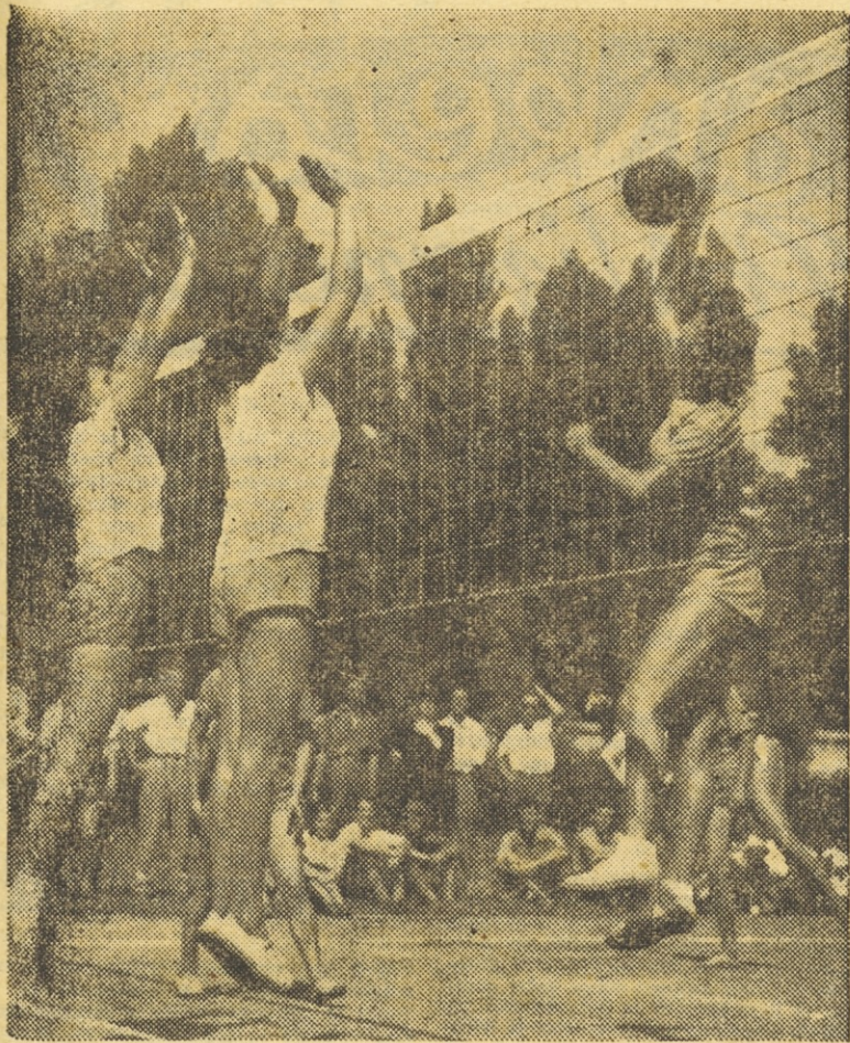
Tudi na odbojgarskih igriščih je danes postalo živahno... V moški in ženski zvezni ligi so se že pričele prve tekme