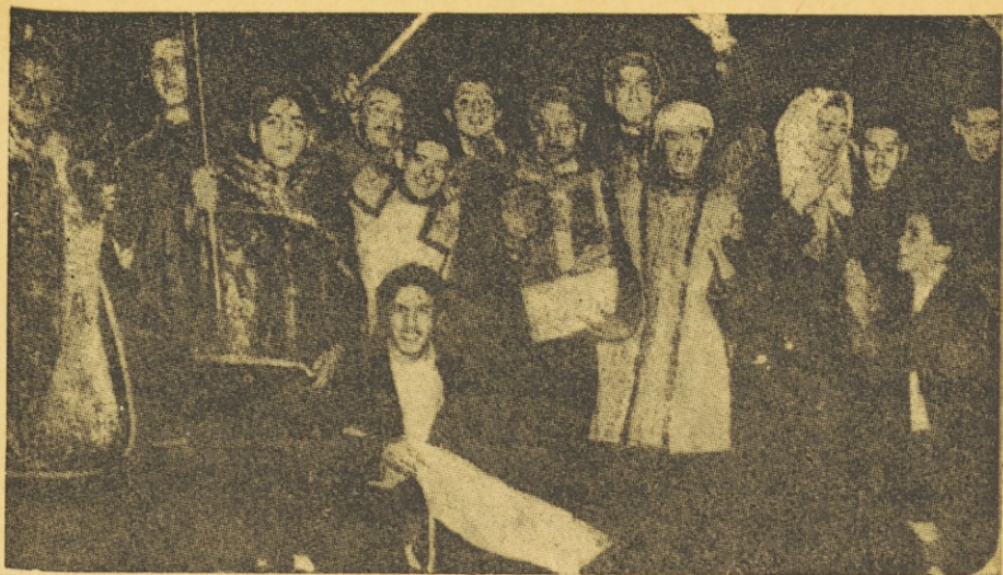
Požigalci so si nadeli liturgična oblačila in v njih bogokletno posnemali svete obrede

v pet tabermakljev v upanju, da v njih kaj najdejo; pobrali so z njih oltarne prte in jih skupaj s preprogami in klopami sredi cerkve zažgali. Najhujšo škodo pa so povzročili s tem, da so zažgali knjižnico za slepe, ki je hranila 2.000 izvodov in bila najbogatejša v vsej latinski Ameriki.