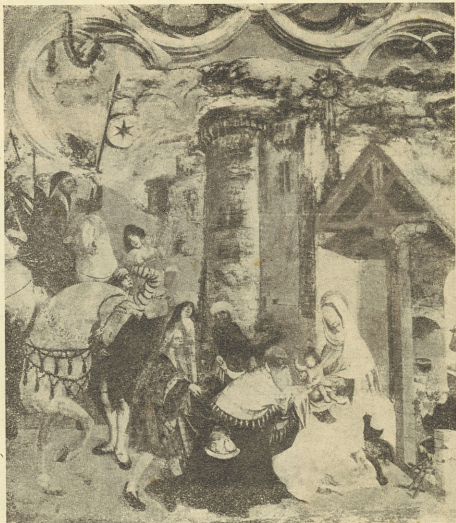
Rojstvo Gospodovo. — Freska pri Sv. Primožu nad Kamnikom. Naslikal jo je okrog leta 1520 neznan umetnik. Shka ima veliko umetniško vrednost.