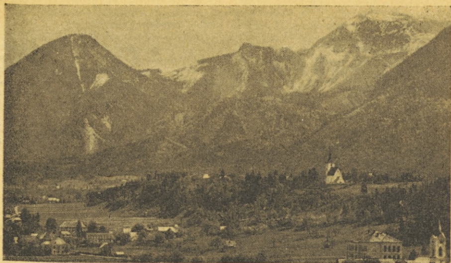
Sv. Jakob v Rožu

— Ker si bila tako zelo pridna, boš šla jutri k sveti maši! Lepšega plačila si pač ne moreš želeti.“