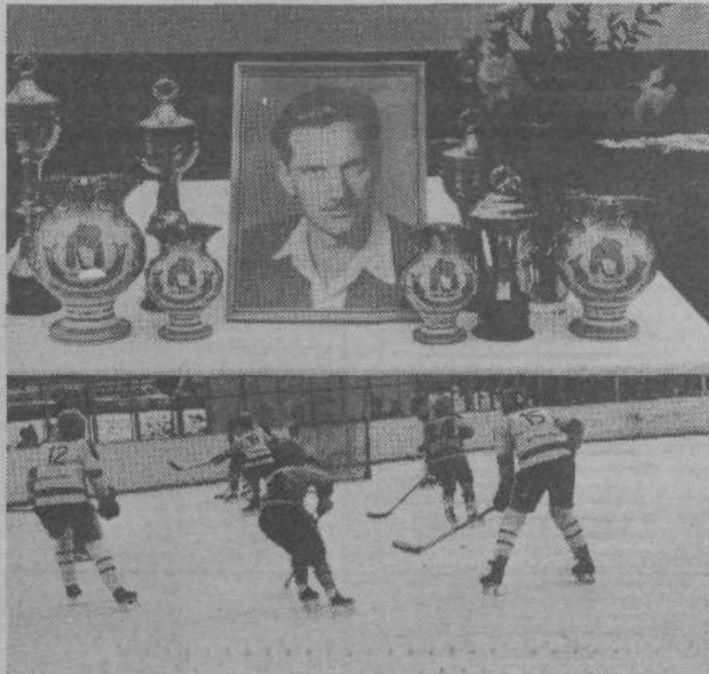
Hudi boji na hokejskem turnirju v Zalogu (Poročamo na 6. strani)