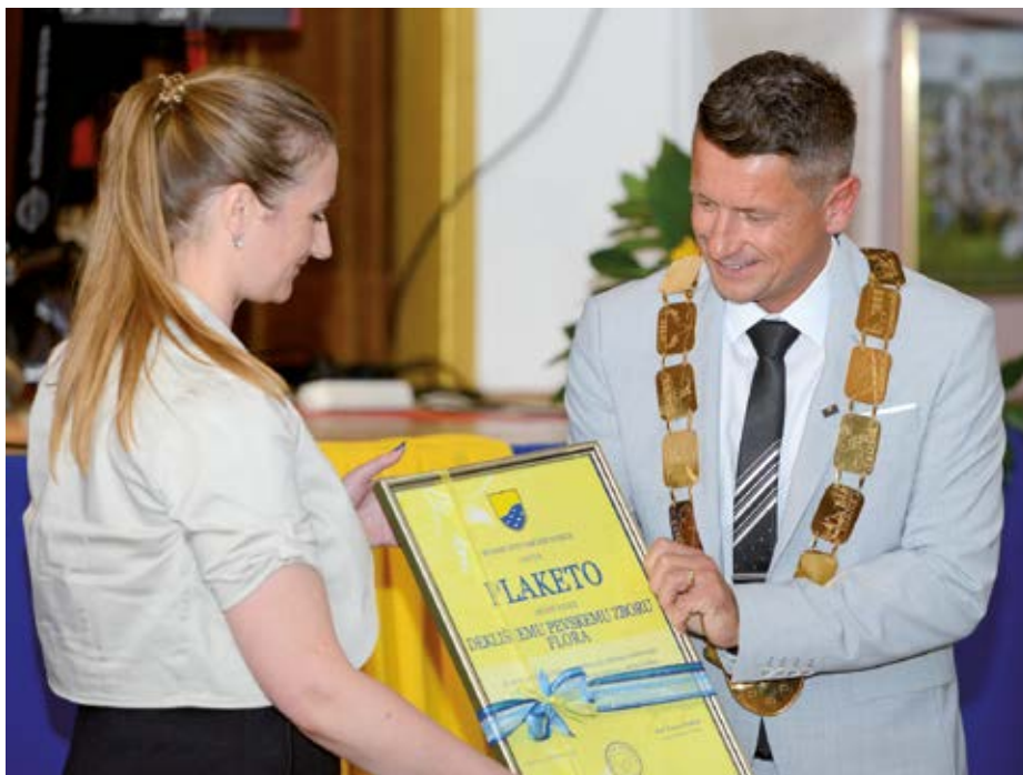
Dekliški pevski zbor Flora