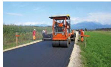
Pred kratkim je izvajalec asfaltiral skupaj dobrih 1,5 km cest na odsekih, kjer je kanalizacija že zgrajena