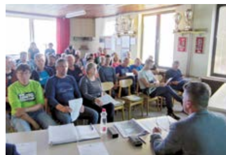
Predstavitve projekta gradnje infrastrukture v Polju je bila dobro obiskana

seznanjal. Zapore cest in obvozi bodo ustrezno označeni in urejeni.