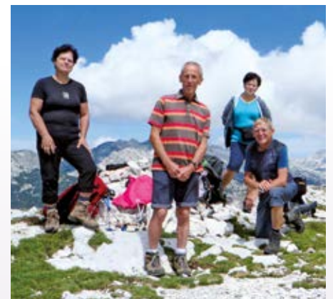
Del pohodnikov na vrhu Lanževice (2003 m)

O pohodih na Lanež in Veliki vrh nad Moličko planino pa kaj več prihodnjič.