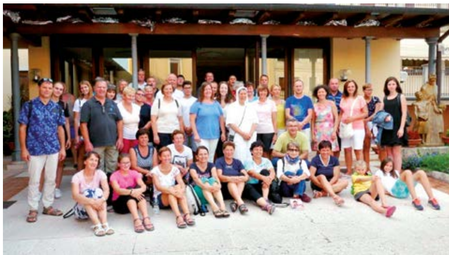
Skupinska slika pred samostanom, v katerem je Sv. Bakhita preživela 45let