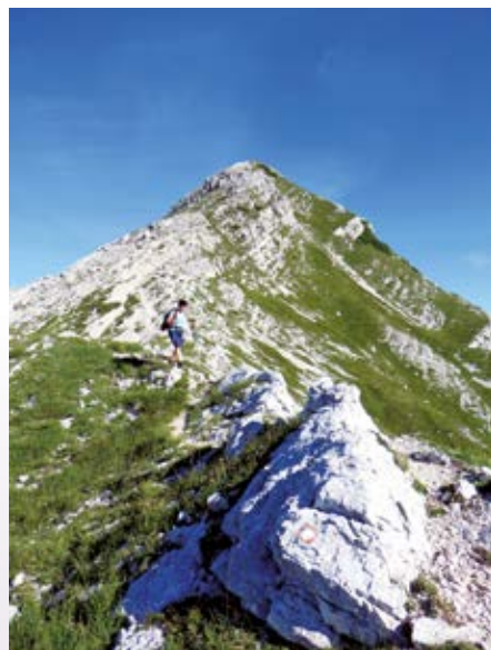
Pogled nazaj na spust z Bogatina proti prevalu med Bogatinom in Mahavščkom

Podrta gora, Kal, Veliko Špiče, tja do Triglava in gora okoli njega). Za vrnitev smo se odločili za pot preko Vratc (Bogatinsko sedlo) do Koče pod Bogatinom. Spust do kočje ni bil zahteven, so bile pa noge že rahlo utrujene in so komaj čakale, da si sezujemo planinske čevlje in se oddahnemo v koči. Zvečer smo povečerjali v koči, malce poklepetali in se dokaj zgodaj odpravili k počitku na skupnih ležiščih. Imeli smo kar precejšno srečo,