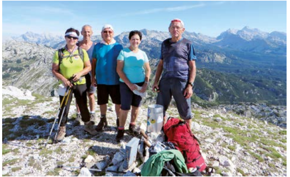
Pohodniki na vrhu Mahavščka (2008m) - desno zadaj je Triglav z okolico

več kot sto leti. Zanimivo in poučno. Sledil je še pohod do Doma na Komni, ki ni tako daleč od planine Govnjač, vendar ko prej opraviš pohod preko Bogatina in Mahavščka, se je dom bolj oddaljeval kot približeval, še zlasti ker je sredi dneva postajalo vedno bolj vroče. Kljub temu nam je uspelo, po več kot polurni hoji, priti v Dom na Komni. Zanimiva je bila ugotovitev, da smo žige, ki jih ni bilo na vrhovih Lanževice in Mahavščka, dobili v domu. Sledil je še spust proti Ukancu v Bohinjski kotlini. Med potjo smo srečevali veliko pohodnikov, ki so se šele vzpenjali proti Komni, kljub popoldanski uri, ko so vrhove, na katerih smo zjutraj stali mi in občudovali razglede, že pokrivale meglice. Mogoče v opravičilo, večina pohodnikov, ki smo jih srečevali, je bilo tujcev, ki ne poznajo naših razmer v gorah. Zaradi utrujenosti je bila pot do Savice, vsaj po občutku, daljša kot je bila dan poprej, ko smo se vzpenjali. Tudi pri kiosku za slap Savice je bila informacijska tabla s podatki o prvi svetovni vojni na območju planote Komne. Najbolj zanimiv je bil podatek, ki sem si ga zapomnil, da