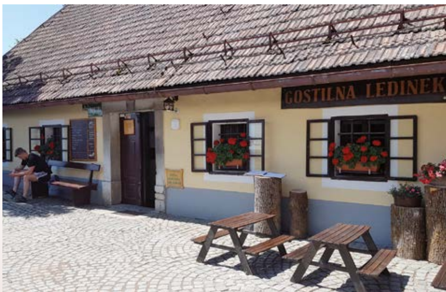
Gostišče je bilo z leti precej prenovljeno

dnosti, ne vemo. Bog je tisti, ki pokliče, človek pa odgovori ali pa ne, zato na tem področju ni mogoče nekaj načrtovati. Zame je bil to lep poklic, že ko sem se odločal zanj, da je pa tudi zelo zahteven, sem spoznaval ob svojem delu na vseh župnijah, kjer sem delal. Je pa nekaj: v našem poklicu ni brezposelnih.