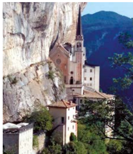
Lebdeča cerkev - Marija della corona

Napočil je zadnji dan našega romanja. Najprej smo se odpeljali do starodavne Marijine božje poti Marija pod krono, ki leži v osrčju pogorja na nadmorski višini nad 700 metrov. Svetišče je zgrajeno pod visoko previsno steno, zato se zdi, da lebdi med nebom in zemljo. Romarji že več stoletij prihajajo na goro in častijo Milostno podobo »Pieta«, leta 1988 jo je obiskal tudi papež Janez Pavel II. Pogled na cerkev, vpeto v skalo, nas je pustil popolnoma brez besed. Nato smo se spustili do Gardskega jezera, po ogledu mesta Sirmione smo se pogumni okopali v jezeru, nato pa se polni lepih vtisov odpravili proti domu. Romanje je bilo lepo, polno doživetij, druženja, premišljevanja in zavedanja sreče ter duhovne poglobitve. Najlepša hvala vsem voditeljem in organizatorjem romanja za bogata duhovna in kulturna doživetja.