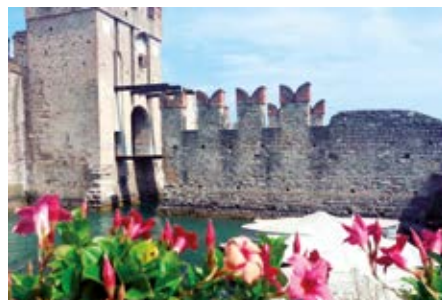
Mestno obzidje v mestu Sirmione