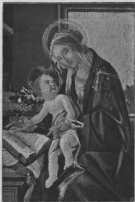
Detece Bozse molimo Te!

V jaszlah lezsécese detece, Bog szi ti, molim te, vklánjam sze ti, bojim sze pred tebom, ár tvoje mále i szlabe roké neszkoncsano vszegamogocsnoszt májo vu szebi, morejo pogübiti, na pekel me szpraviti. Drági krsccsenik, gda na oltár zaglédnes to málo belo hostijo, stera je tak szlaba, ka sze niti genoti nemore, ka miszlis, i ka verjes ti od njé? To jeli ka gda jo ováras, trdo verjes „Znami je Bog“. Cse tak, blázseni szi, ár, kak szám Jezus právi „blázseni, ki szo ne vidili i vervuli szo“. Blázseni szi i blá-