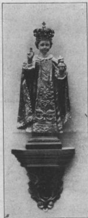
Podoba práskoga Jezuseka pri Svetom Szebestjani.

zvoscseni oblecs, ta najbole proszta jesztvina ; naj raj je ono krühovo szkórje potroso, ka je od sziromakov osztalo. Posztela je goli tla bio, za zglavnik je pa eden pén meo i tak kratko lezsiscse szi je narédo, ka sze nigdar ne mogeo vövtégnoti. Csi je szamo mogao, sze je k Oltárszkomi Szvesztvi szilo, gde je vnogokrat vecs vür dugo