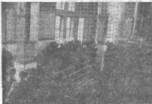
V Mali kruši so ogromne kletne kapacitete — to so lahko videli tudi predstavniki Slovina in njihovi gostje

Poslovno-tehnični odnosi med SLOVINOM in AGROKOSOVIM potekajo že dve desetletji in lahko trdimo, da se iz leta v leto uspešneje razvijajo in poglobljajo v obojestransko zadovoljstvo. Za primerjavo služi podatek, da je trgatve iz leta 1977 na Kosovu za Slovin pomenila 1.000 vagonov vina, seveda pa je bil začetek poslovno-tehničnega sodelovanja skromnejši. Tako je leta 1961 Slovin kot kucec prevzel le 200 vagonov vina. Takšen količinski porast ni le posledica čvrstih tradicionalnih poslovnih vezi med Slovinom in vino-