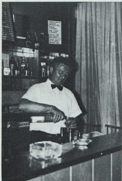
Náš Stane, vedno nasmejan in ustrezljiv, je gostom všeč

Ko premišljujem o njem, me obide misel, kako lepo bi bilo, če bi bilo veliko ljudi, ki bi bili tako zadovoljni s svojim delom, kot je on.