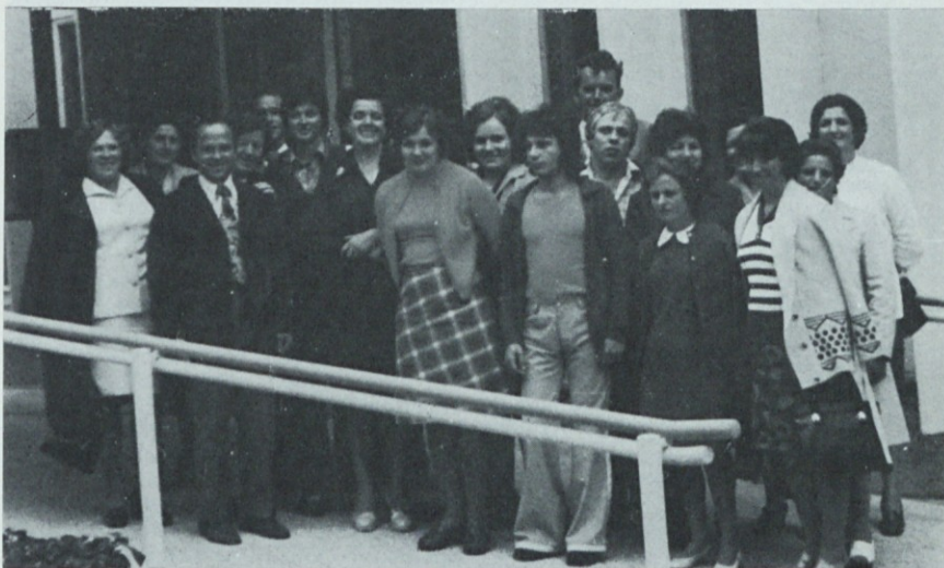
Člani OOS predilnica na obisku v Predilnici Litija septembra lani