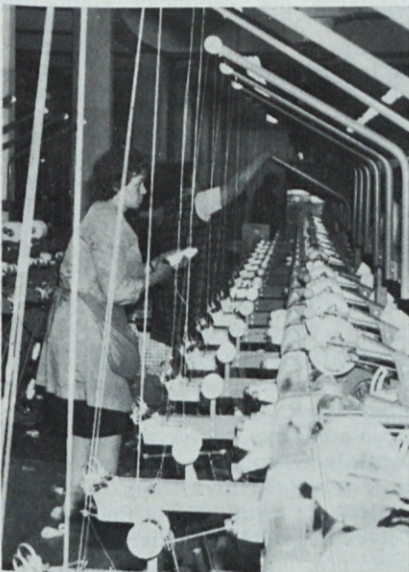
Vestno delo — dvig produktivnosti in kvalitete

Osnovna organizacija ZK je bila močno angažirana pri organiziranju naše sindikalne organizacije in to po načelih, katere je sprejel VIII. kongres ZSS. Tako so bile organizirane sindikalne grupe, odbori, konference in izvršni odbor in to tako, da je to v skladu in povezavi organiziranja samoupravljanja. Ta način je bil izbran zaradi lažjega obravnavanja in sprejemanja internih aktov, planov (Nadaljevanje na 2. strani)