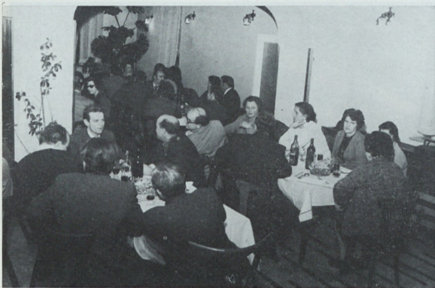
Pogovor o skupnih spominih je kmalu stekel

Sedaj imajo lepo telovadnico. Zelenela bi, da bi bila dobro oskrbovana; zelo bom vesela, če bo za menoj prišla taka, ki bo tako rada delala kot sem jaz in imela ljudi tako rada. Mladim želim veliko uspehov in športne sreče; sedaj imajo res dobro vse urejeno. Želim jim veliko navdušenja. Športnik mora biti pravi človek, da ne gleda, kaj se »splača«;