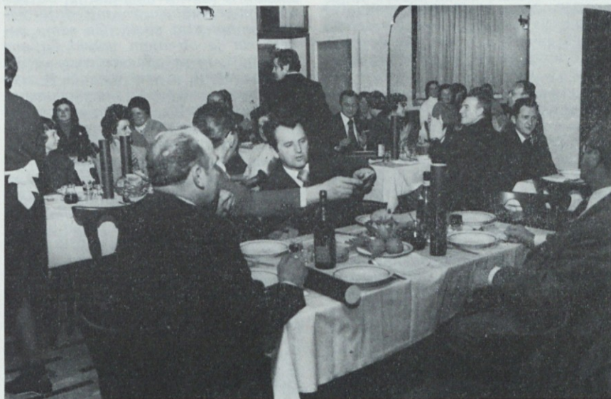
Vsak jubilarnt je dobil priznanje

Glede uporabe bona se še nisem odločil, verjetno bomo to reševali v družinskem krogu.