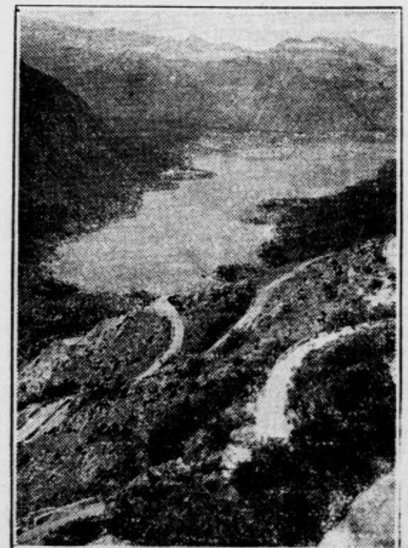
Pogled z lovčenskih serpentin na kotorski zaliv

Zunaj pred dvorcem pa že trobiljo avtobusi, usnje je razgredo in prašno. V prah in hlad se poženejo iz Cetinja na drugo