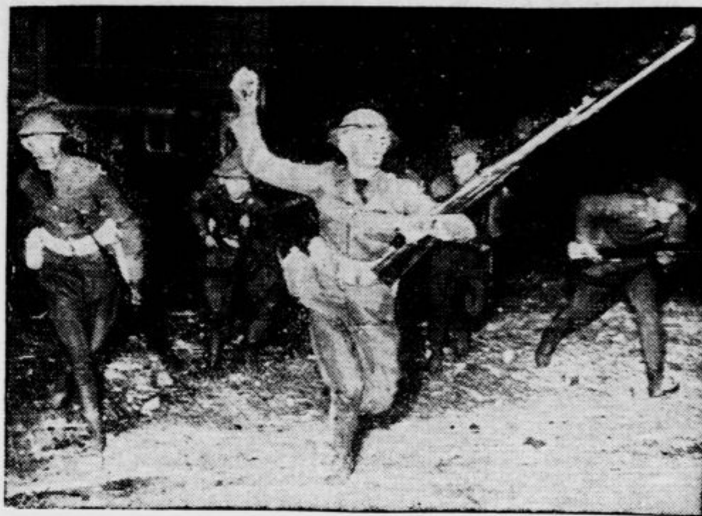
Tako razganjajo ameriški policisti stavkajoče delavstvo