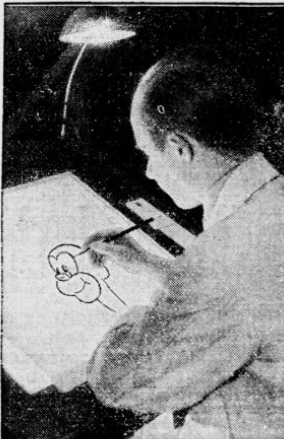
Vsaka sekunda giba, na primer zatnjenja oči, zahteva 25 takih risb