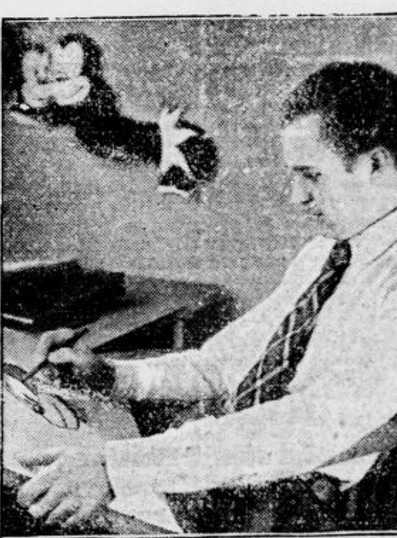
Že pri osnutku je treba gledati na to, da bo podoba gibe, ki so ji namenjeni, izvedla lagotno in vzneseno