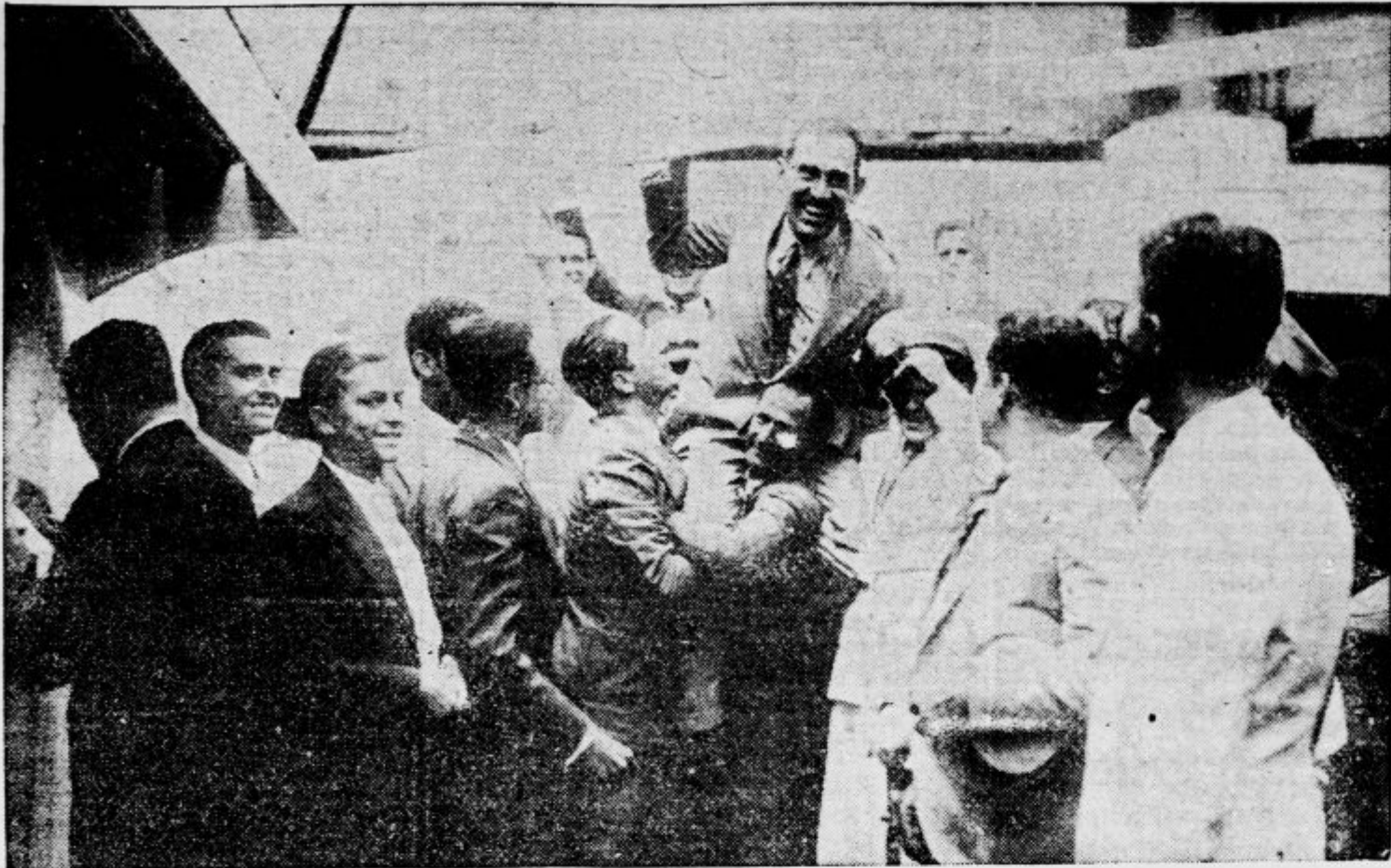
Takole so na Kubi sprejeli državnega poglavarja Gran San Martina, ki se je vrnil domov s študijskega potovanja po Mehliki. Mladina v Havani ga je naložila na rame in ga nosila po ulicah