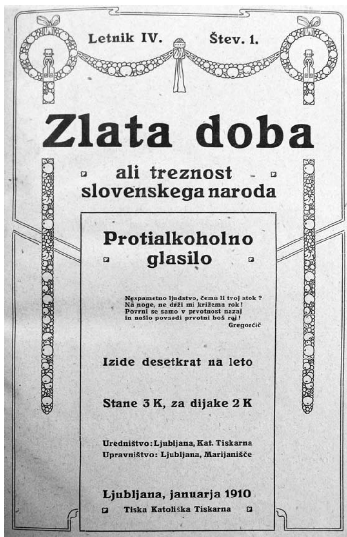
Naslovnica protialkoholnega glasila Zlata doba (1910).

iz vseh ljudi napraviti abstinentov.« Abstinenti bi radi delali tudi z zmernimi ljudmi, ki nočejo povsem opustiti alkohola: »To bodi na glas povedano onim, ki mislijo, da hočemo vse pohrustati.« Takšnim podpornikom je bila namenjena znamenita druga stopnja »zmerništv«. Drugi princip je bil narodno-gospodarskega značaja: »Mi ne želimo vseh vinogradov uničiti.« Čeprav bi vinogradnikom tudi po Kalanovem mnenju druge panoge nesle dovolj, pa nima »takih hudobnih namenov, da bi jim hoteli uničiti vinograde«. Za Kalanov osebni odnos do alkohola je še zlasti zanimiv tretji princip, ki se je nanašal na znano polemiko s Škrabcem: »Če se zdržujemo vsakega alkohola, ne storimo tega zato, ker bi mislili, da je vsaka kaplja alkohola strup.« Po Kalanovem mnenju se ne bi smeli obremenjevati z vprašanji v stilu, češ, ali je en kozarec vina škodljiv. »Meni ni merodajen moj