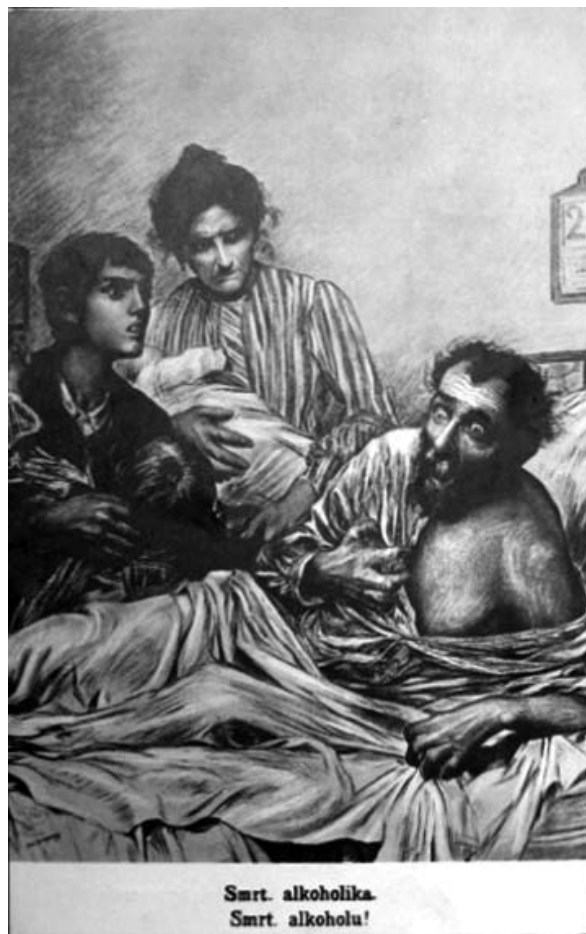
Strašna alkoholikova smrt. (Dopisnica Svete vojske)

polnoma ustrezajo izgovorom, ki jih pivci običajno trosijo v obrambo svoje razvade. Kalan je najprej razložil, zakaj se je odločil za abstinenco: »Načelo moje je bilo v tem oziru vedno to: Ne zdržujem se pijače zato, ker je sama na sebi slaba, napačna, škodljiva ali grešna; zdržujem se je zato, ker vidim v abstinenci uspešno orožje proti alkoholizmu. Zdržujem se je zlasti zato, da bi pri nas, v naši domovini premagali pijančevanje in uvedli treznost.« Skratka, Kalan abstinira zgolj zato, ker hoče biti za zgled ljudstvu, ne pa zaradi prepričanja, da se alkohola ne bi smelo piti. Njegova trditev je še zlasti zanimiva, če jo pogledamo iz drugega konca. Če na Slovenskem ne bi bilo pijančevanja, bi lahko dušebrižni Kalan brez slabe vesti popival. Poslušajmo prvi izgovor: »Vse kaj drugega je, če človek potuje sam ali v veliki množici. /.../ V veliki množici človek ne more, kakor bi si ravno izmislil, ampak se mora ravnati po ostali množici.« Kdo ne pozna tega izgovora? Pijem zato, ker pijejo drugi. Naslednji izgovor je s prvim v tesni navezi: »Vse kaj drugega je tudi, če človek potuje po krajih, kjer