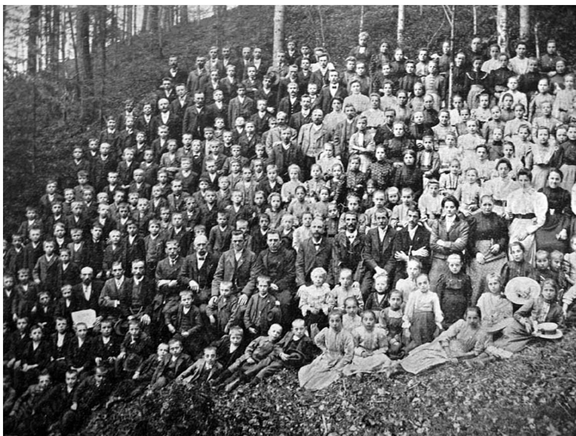
(Prvo)majski izlet abstinentov na Homec leta 1910.