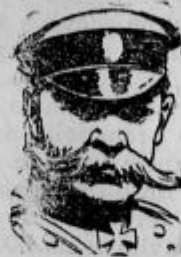
Ruski general Rennenkampf.

stvu treh torpedovk v notranjo luko. Ko je ladja pristala, je izstopilo nekaj francoskih častnikov, in obenem so razkladali material za brezžično postajo. V Skadrskem jezeru bo zgrajena v bližnji prihodnosti brezžična postaja z veliko napetostjo in bo v zvezi s Parizom. Druga manjša brezžična brzojavna postaja se zgradi na Lovčenu. Lovčenska brzojavna stanica ima posredovati zvezo med črnogorskimi baterijami in francosko vojno mornarico.