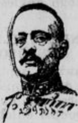
General Svetozar Boroević pl. Bojna, ki je na severnem bojišču izvojeval lepe uspehe.