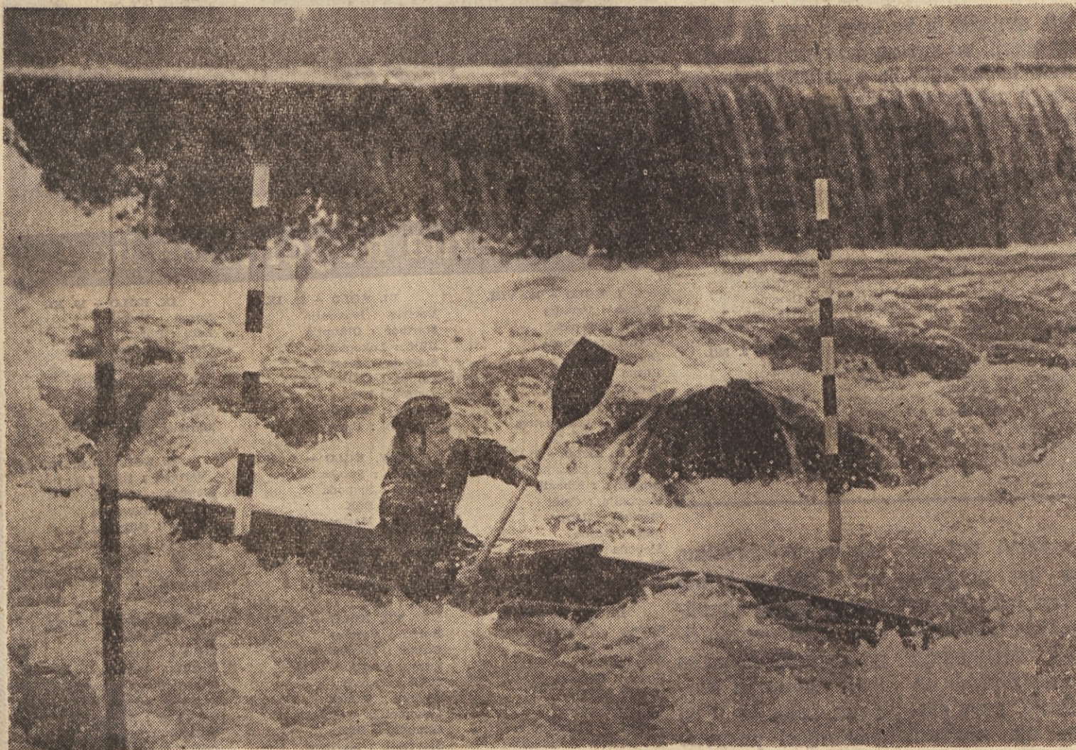
Med najboljšimi tekmovalci je bil danes v Tacnu tudi Jugoslovan Bogdan Svet

Duisburg - V drugem kolu vaterpolo turnirja so bili doseženi naslednji rezultati: Francija : Španija 3:1, Anglija : Zah. Nemčija 2:2, Nizozemska : Belgija 5:4, v tretjem kolu pa: Nizozemska : Španija 5:0, Zahodna Nemčija : Belgija 6:3, Anglija : Francija 4:2. Na lestvici vodi Nizozemska pred Zahodno Nemčijo, Anglijo, Francijo, Belgijo in Španijo. Turnir bo danes zvečer zaključen.