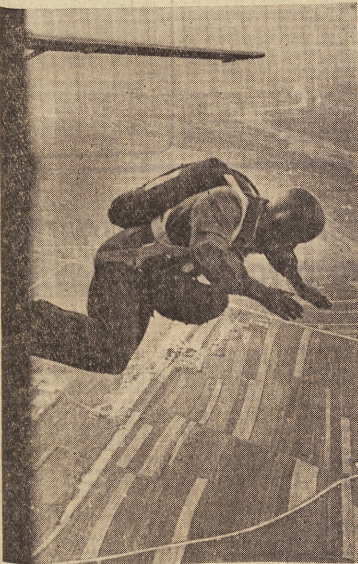
Mnogo drznost je treba za skok iz letala

Uporabljali pa ga niso samo piloti. Jeseni 1935. leta so številni vojaški atašeji komaj lovili sapo, ko so jih povabili na manevre Rdeče armade v bližini Kijeva in so lahko opazovali zračni desant tisočev padalcev. Padala pa so pričeli uporabljati tudi za odmetavanje zračnih pošiljk v težko dostopnih krajih, z njimi so opremljali reševalce, gasilce gozdnih požarov, v zadnjem času pa jih uporabljajo tudi astronomi, ko se vračajo v zemeljsko atmosfero.