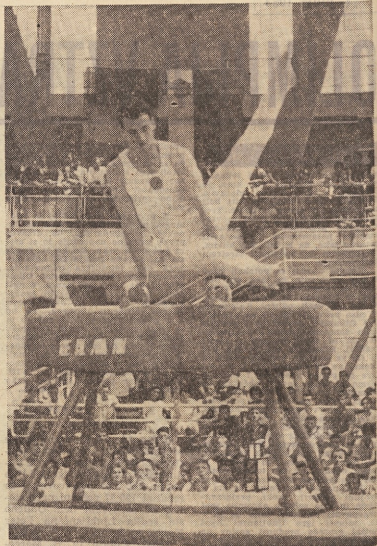
MIRO CERAR JE OPRAVIČIL NASLOV, KI GA JE OSVOJIL LANI NA SVETOVNEM PRVENSTVU V PRAGI ZA SVOJO VAJO NA KONJU

Srečala sva se spet pri razglasitvi rezultatov, ko sva drug poleg drugega stala na zmagovalnem odru.