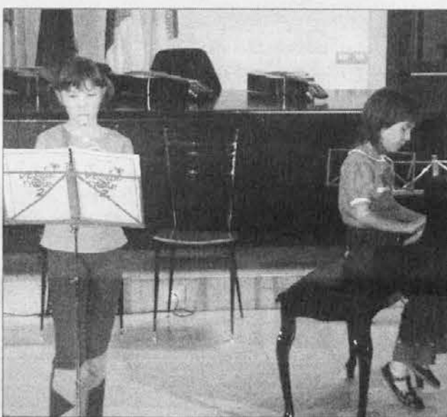
Glasbeni pouk se vse bolj širi med beneško mladino

li ob praznovanju 25-letnice, ki ga bomo priredili v teku tega leta".