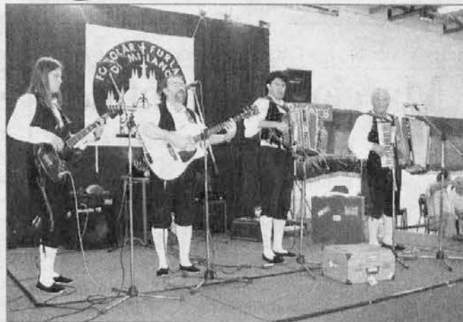
I Bintars a Milano

Dopo la pausa estiva il Fogolar Furlan di Milano ha proposto, sabato 21 settembre, un gioioso pomeriggio con "I Bintars", noto complesso friulano che si è esibito in ogni parte del mondo. L'incontro con i friulani in Lombardia, presso la Sala del Centro Polifunzionale del Polo Ferrara a Milano, è stato inoltre un'ulteriore occa-