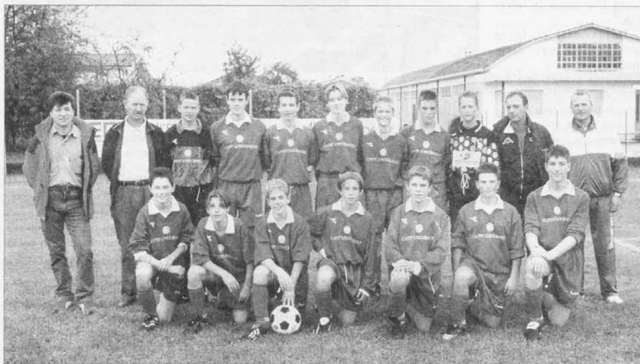
I Giovanissimi della Valnatisone hanno conquistato il primo successo in campionato