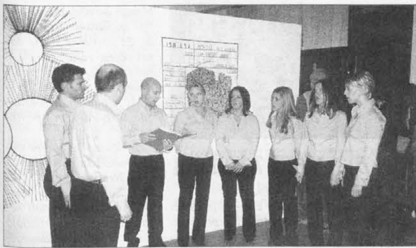
Beneške korenine v soboto v Beneški galeriji