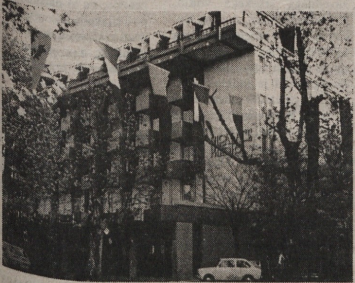
PH-PALACE HOTEL, Corso Italiana 63

34 170 Gorizia-Gorica, Italy; Tel.: 0481-82166; Telex 461154 PAL GO I