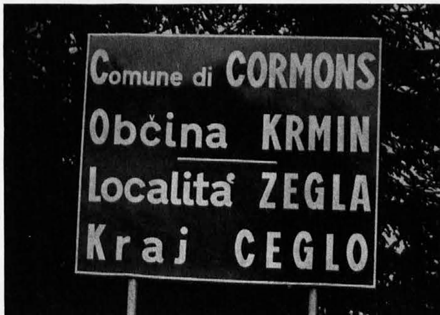
Krminska občina je dala postaviti v krajih, kjer živijo Slovenci lične napise, ki delajo čast občinski upravi in so naraven izraz spoštovanja med obema narodnostnima skupinama na tem področju