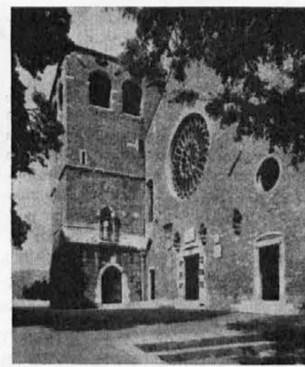
Stolnica sv. Justa v Trstu

Zato pomeni omenjena resolucija odstopanje od naših pravičnih zahtev in ponovno izigravanje naših pravic ter poizkus, da se uveljavitev slovenščine v krajevnih upravah odloži za nedoločen čas. Tako zadržanje moramo še posebej ožigosati,