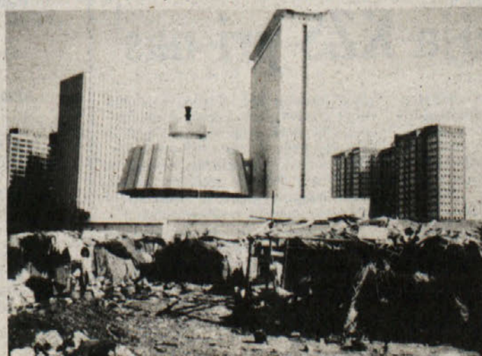
V tem posnetku je sintetizirano nasprotje današnje indijske družbe; v prvi vrsti barake, zadaj razkošni nebotičniki

vojski dodelili več kot bi jih proporcionalno zaslužili. Podpirali so ločno šolstvo, tako so ob islamskih šolah nastajale tudi hindujske in sikhovske. Na železniških postajah so uvedli ločne restavracije za hindujce in muslimane. Tako so postajali spopadi med muslimani in hindujci nekaj vsakdanjega. Muslimani so npr. ob prazniku bakrid, ko je Abraham ponudil svojega sina kot žrtev, zelo radi žrtvovali kravo namesto ovna ali kozla, ki je za hindujce sveta žival. Leta 1906, ko je prišlo do ustanovitve muslimanske zveze, ki je zahtevala ustanovitev samostojne