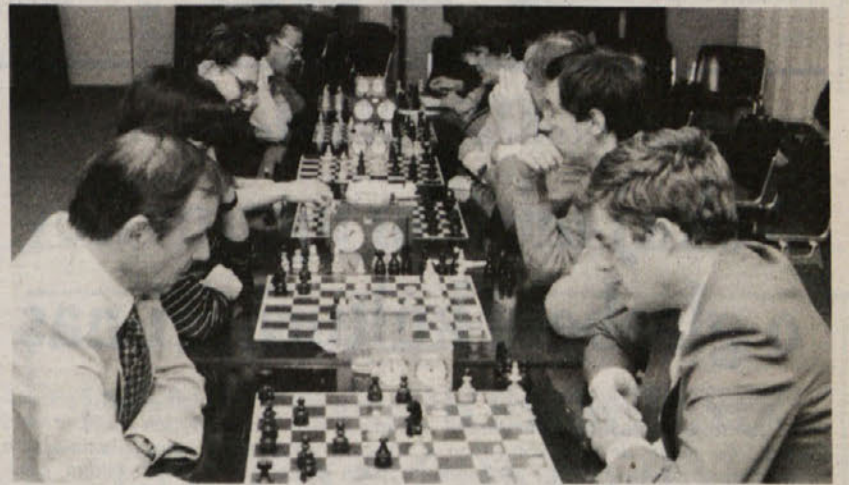
V organizaciji ZSŠDI je bil v petek v Gregorčičevi dvorani v Trstu prvi sezonski brzopotezni šahovski turnir, ki se ga je udeležilo 12 naših šahistov. Na sliki: posnetek s petkovega turnirja