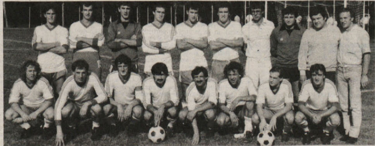
Nogometaši trebenskega Primorca (na sliki), ki igrajo v 3. amaterski ligi, so tudi letos v borbi za napredovanje v višjo kategorijo