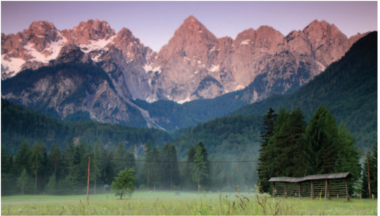
Slika 4: Prve dokumentirane osvojitve vrhov Špikove skupine so se zgodile razmeroma pozno.