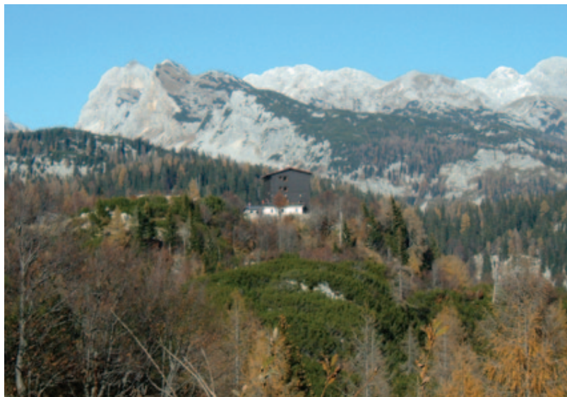
Slika 2: Strma, kamnita ali gosto poraščena gorska pokrajina je v evropski literaturi dolgo veljala za neprivačen in nevaren svet. V renesansi se je ta podoba začela spreminjati in v sodobnosti gore marsikje predstavljajo prostor oddiha, sprostitve in stika z naravo. Na fotografiji so osrednje Julijske Alpe z domom na Komni v ospredju.