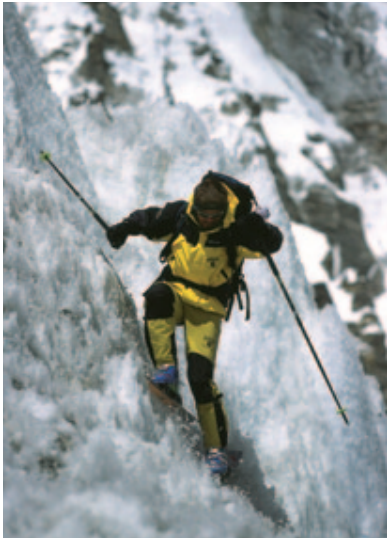
Slika 14: Dava Karničar je prvi Zemljan, ki se je s smučmi spustil z Mount Everesta, najvišje točke sveta. Ekstremni alpinistični spust mu je uspel leta 2000.

A športnim uspehom ali neuspehom navkljub velja, da je v Sloveniji najbolj znana in obiskana športna prireditve tekma v smučarskih poletih. Posebno, več kot 50-letno tradicijo pa imata tudi tekmi alpskega smučanja, Pokal Vitranc v Kranjski Gori in Zlata lisica na Pohorju, ki sta redno na koledarju svetovnega pokala Mednarodne smučarske zveze. Seveda pa ne moremo mimo alpinizma in z njim povezanih uspehov, ki so Slovence v 70 ih letih preteklega stoletja povzdignili med alpinistično najpomembnejše narode z mnogimi vrhunskimi dosežki, ki jih je prepoznala tudi svetovna stroka, doma pa so praviloma dosegli veliko odmevnost. Taki so na primer vzpon po verjetno še vedno najtežji prvenstveni smeri na najvišji vrh sveta leta 1979, vzponi Tomaža Humarja, smučarski spust Dava Karničarja z Everesta, nenazadnje pa tudi dejstvo, da smo Slovenci doslej prejeli kar sedem