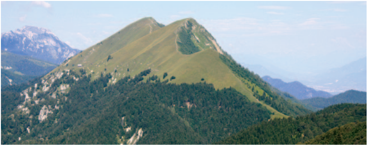
Slika 15: Gora Golica ima za Slovence poseben pomen, saj je njeno ime je svet ponesla najbolj znana svetovna polka.