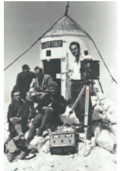
Slika 12: Snemanje filma V kraljestvu Zlatoroga, prvega slovenskega nemega, črno-belega celovečernega filma, je potekalo na Triglavu in v njegovi bližnji okolici.

Tako kot drugi alpski narodi smo tudi Slovenci v gorah skovali velik del narodove mitologije. Že v uvodnih razmišljanjih smo zapisali, da so gore svet, ki je kot nalašč za kovanje mitoloških zgodb, ki razlagajo nerazumljivo, nepredvidljivo in neukrotljivo gorsko naravo. A Slovenci se nismo ustavili le pri tem. Gorsko mitologijo smo uspešno prenesli tudi v slovenski kulturni prostor, ki je, zavedajoč se tega ali ne, tako rekoč del vsakega Slovenca. Najsi gre za »večne« Vandotove Kekčeve ukane z jasnim sporočilom, kako dobra misel in korajža premagata marsikatero oviro, ali pravljico o Zlatorogu z jasnim sporočilom, kako pohlep vodi človeka in živi svet okrog njega v pogubo. Ne pozabimo, da smo tudi Kralja Matjaža postavili v goro (Peco), gora Bogatin, ki naj bi dobila ime po zakladih v njem, pa nam v 21. stoletju svoje izročilo razlaga na prav poseben, sodoben način. Območje gora na Komni, med katerimi je tudi Bogatin, prejme ogromno padavin, voda, ki jo hranijo mogočni skladi krnskega na-