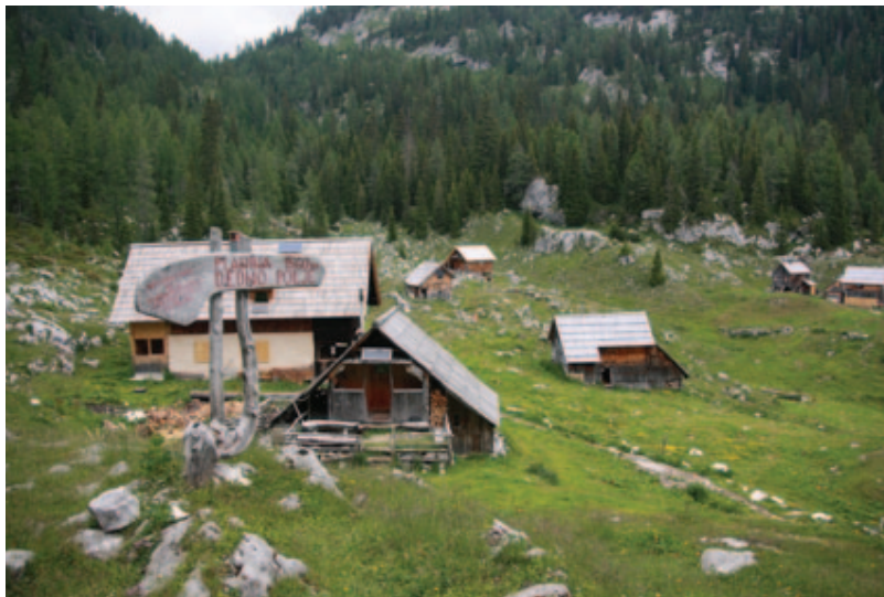
Slika 1: Planina Dedno polje danes kaže idilično plansarsko podobo, a je precej pred pastirji služila iskalcem rude.

Intenzivna poselitev Bohinja, ki se začne v 7. stoletju pr. n. št., je pustila sledove na primer tudi na Ajdovskem gradcu, Dunaju pri Jereki, v Bitnjah, Jereki, Žlanu in Lepencah. Pri tem je imela pomembno vlogo železarska