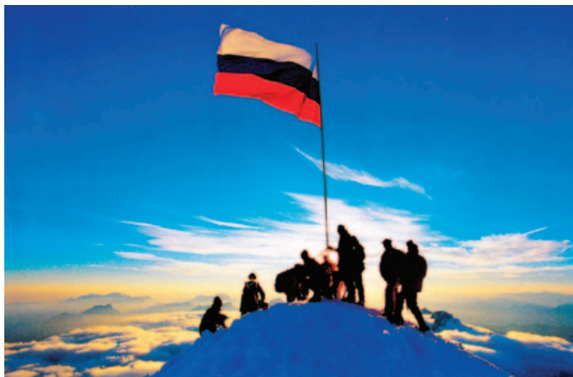
Slika 9: 25. junija 1991, potem, ko je slovenska skupščina sprejela deklaracijo neodvisnosti, je Slovenija postala samostojna država. Naslednji večer, 26. junija 1991, je na Trgu republike v Ljubljani potekala slovesnost, na kateri je bila prvič dvignjena nova slovenska zastava. Ob predstavitvi simbola novonastale države so tisti, ki so dogajanje v glavnem mestu spremljali prek televizijskih zaslonov, lahko videli tudi posnetke plapolanja zastave na našem najvišjem vrhu Triglavu. Zastava je bila še brez grba, saj so posnetek njenega plapolanja naredili nekaj dni prej, 12. junija.