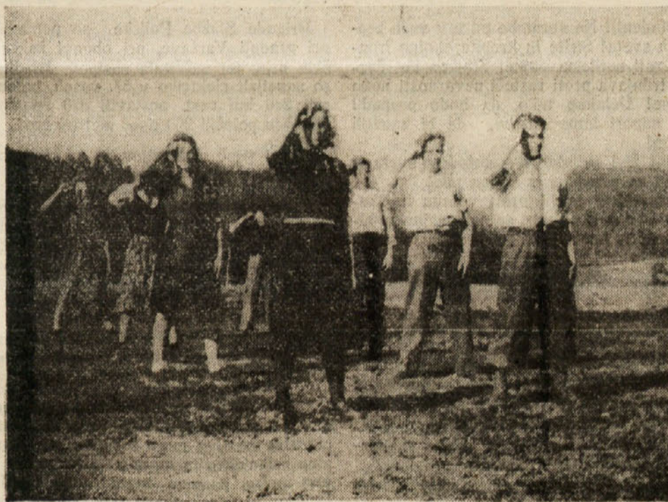
Pripravljamo se na mladinski dan

Vendar pa mladina, ki je v Žitari vesi, zna izkoristiti tudi prosti čas. Po večerih vidiš, kako se mladinci učijo fizikulturne vaje. Z velikim zanimanjem grejo tudi tukaj na delo. Vidiš pa tudi, kako si medsebojno pripovedujejo o težkočah in težavah pri delu. Mladina si tukaj izmenja svoje izkušnje in na tej podlagi bo v bodoče mladinsko delo marsikje zaživelo v novem poletu.