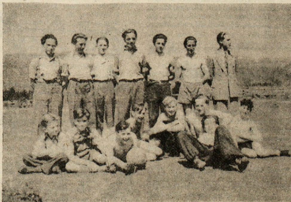
Nogometna skupina iz Roža

Ob svetovnem mladinskem tednu Ljudska mladina Jugoslavije toplo pozdravlja bratsko mladino Slovenske Koroške in ji želi, da v svoji borbi doseže še večje uspehe.