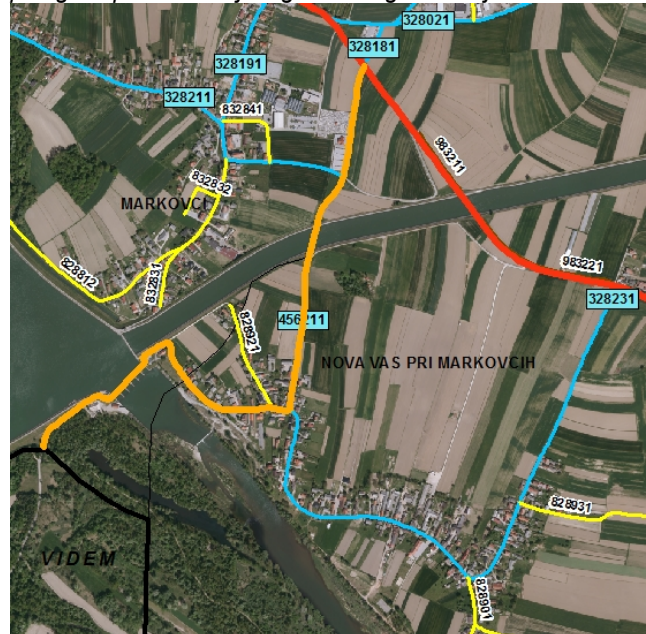
NOVO STANJE: LC 456211