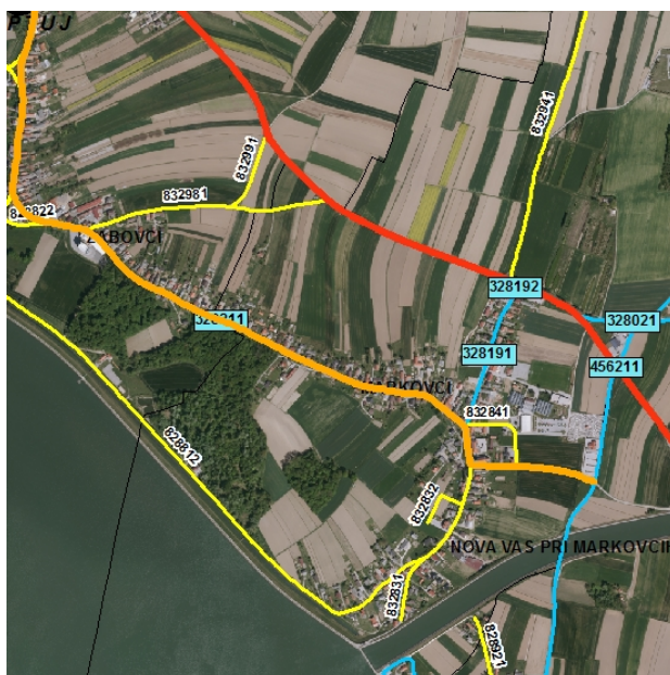
NOVO STANJE: LC 328211