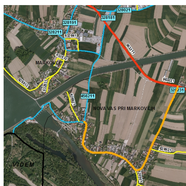
NOVO STANJE: LC 328231