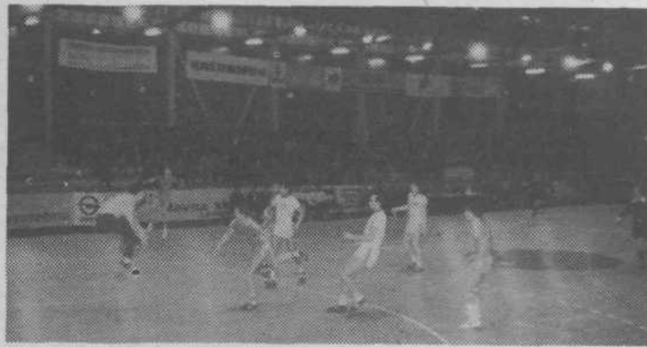
Prizor s tekme Kolinska-Slovan: Partizan Bjelovar

Zanimanje za tako rekreacijo je zelo veliko, saj se je prijavilo kar 22 ekip, največ iz delovnih organizacij in klubov naše občine, nekaj pa tudi od druge. Moštva, ki so se samostojno formirala in prijavila, že tekmujejo. Pozivamo pa jih, da se čimprej povežejo s krajevno skupnostjo, v kateri živijo.