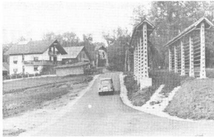
Dragoceni metri asfalta proti vasi Kremenca

V Devinski ulici je bolnica, v bližini še šola in dva vrta ter dom starostnikov. Tu je veliko pešcev, ker je samo en hodnik za pešce, pa še na tem parkirajo gostje bližnje okrepčevalnice »Julčič« in trgovine za jadrnice.