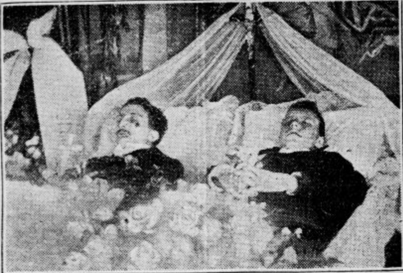
Fotografija je bila l. 1908. v tisoč in tisoč izvodih kot slika in razglednica razširjena po vsej Sloveniji. Objavili so jo tudi številni slovanski listi in revije