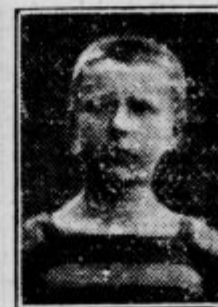
spoznanje let, so prekvareni ti daljni spomini...