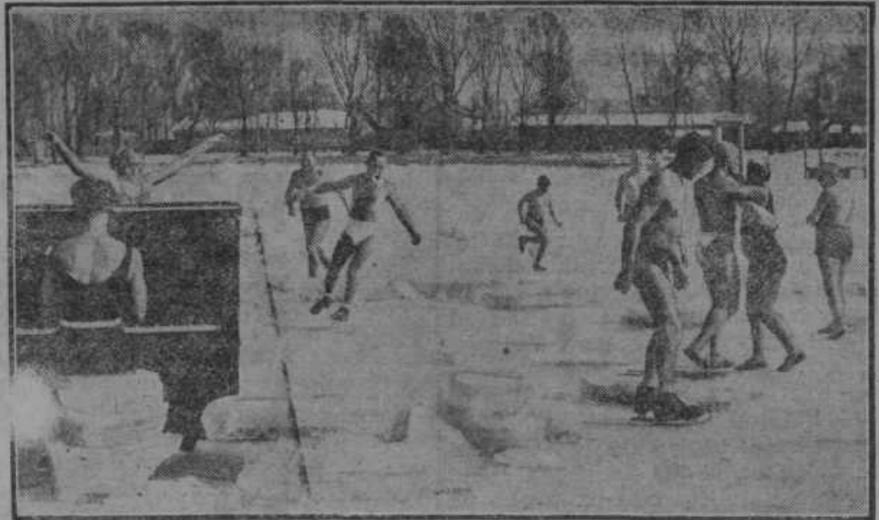
Na Dunaju so drsali po ledu pri 10 stopinj mraza.