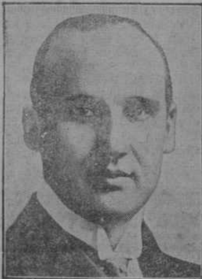
Evropski kralj užigalic Ivar Kreuger, ki se je ustrelil v Parizu radi finančnega poluma.

Po polurnem posvetovanju je senat obsodil odgovornega urednika »Jutra« v smislu obtožbe na 500 Din denarne kazni, eventualno v slučaju neizterljivosti v 10dnevni zapor in nato še v nadaljnjih 120 D denarne kazni. »Jutro« je dalje obsojeno v plačilo pravnih stroškov in da mora v 2 številki po pravomočnosti objaviti sodbo na čelu lista. Zastopnik »Jutra« je prijavil priziv.