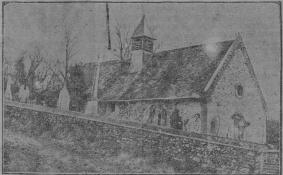
Podeželsko pokopališče v vasi Cocherel, kjer so pokopali bivšega francoskega zunanjega ministra in apostola miru Brianda.