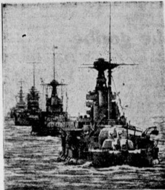
Angleško brodogradnja na Daljnem vzhodu

To je program, od katerega Anglija v nobenem primeru ne bo odstopila, naj se potem pomorska konferenca posreči ali ne posreči.