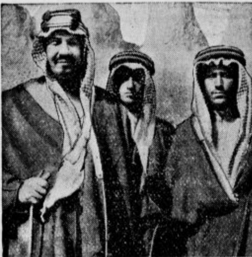
Ibn Saud in njegova sinova

Prvič se v zgodovini zopet omenja bratstvo arabskih narodov