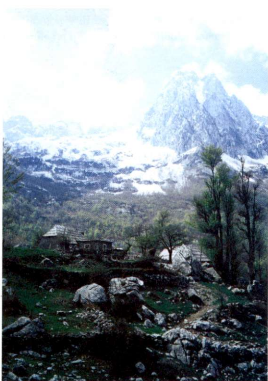
Slika 3: Apneniške Severnoalbanske Alpe na skrajnem severu države zaradi svoje geološke sestave v marsičem spominjajo na naše Alpe. Poselitev je tu izredno redka. Na sliki vidimo eno najvišjih samotnih kmetij.

Albanija je imela ob zadnjem popisu prebivalstva (2. 4. 1989) 3,2 milijona prebivalcev. V času, ko je gibanje za demokratizacijo načelo dolgoletno diktaturo, se je začel tudi množičen beg iz države. To se je dogajalo predvsem v letu 1990. Simboličen pomen so imele prve demokratične večstrankarske volitve marca 1991, vendar se je beg iz države nadaljeval tudi po tem datumu in traja v nekoliko zmanjšanem obsegu še danes. Državo je tako (večinoma ilegalno) zapustilo nekaj stotisoč ljudi. Točnih podatkov o tem eksodusu ni na voljo. Po nekaterih neuradnih in nepreverjenih ocenah naj bi bilo število teh emigrantov že blizu 500 000.