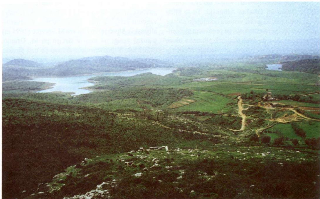
Slika 1: Nizko Albanijo sestavljajo kvartarni nanosi in terciarno gričevje. Slika je bila narejena v okolici Kruje na mestu, kjer se nižji svet Nizke Albanije začne dvigovati v Albansko predgorje.

V grobem bi lahko ločili štiri višinske rastlinske pasove. Najnižji je pas sredozemske makije, ki običajno sega do nadmorske višine 200 m. Sledi pas hrastovega gozda. V Severnoalbinskih Alpah leži v tem pasu večina vasi, saj poletja tu niso več tako vroča. Na jugu države v Epiru segajo hrastovi gozdovi celo do gozdne meje. V tretjem pasu se bukev menjava z iglavci. Tu je zlasti v Severno-