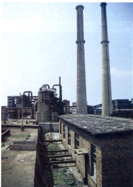
Slika 4: Tovarna umetnih gnojil v Lacu kljub svoji zastareli in povsem dotrajani tehnologiji še vedno obratuje. Odkar so zaprli metalurški kombinat v Elbasanu, predstavlja ta tovarna največji ekološki problem v državi.

Absolutno število zaposlenih oseb se je v razdobju med letoma 1970 in 1985 povečalo za približno 55 %, pri čemer pa se je delež zaposlenih povečal le za malenkost (od 42,2 % v letu 1970 na 45,9 % v letu 1985). To si lahko razlagamo z večjim številom novorojenih in z daljšim izobraževanjem mladih.