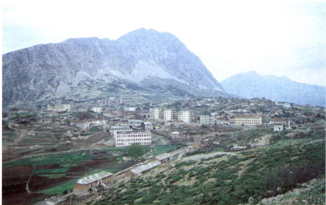
Slika 2: Mesto Leskovik ima izredno slikovito lego sredi divjih gora jugovzhodne Albanije. Tu poteka meja med notranjimi in zunanji Albanidi.

Albanija ima veliko ribjega bogastva. To velja tako za njeno morje kot za jezera in reke v notranjosti. Med 260 vrstami rib so zastopane vse vrste, ki jih najdemo v Sredozemskem morju. V bližini obale so predvsem sardele, skuše, tune in jegulje. Za reke v notranjosti je značilna postrv. Posebnost predstavljajo ribe v velikih jezerih v notranjosti. Najbolj znana je ohridska postrv, ki ji po albansko