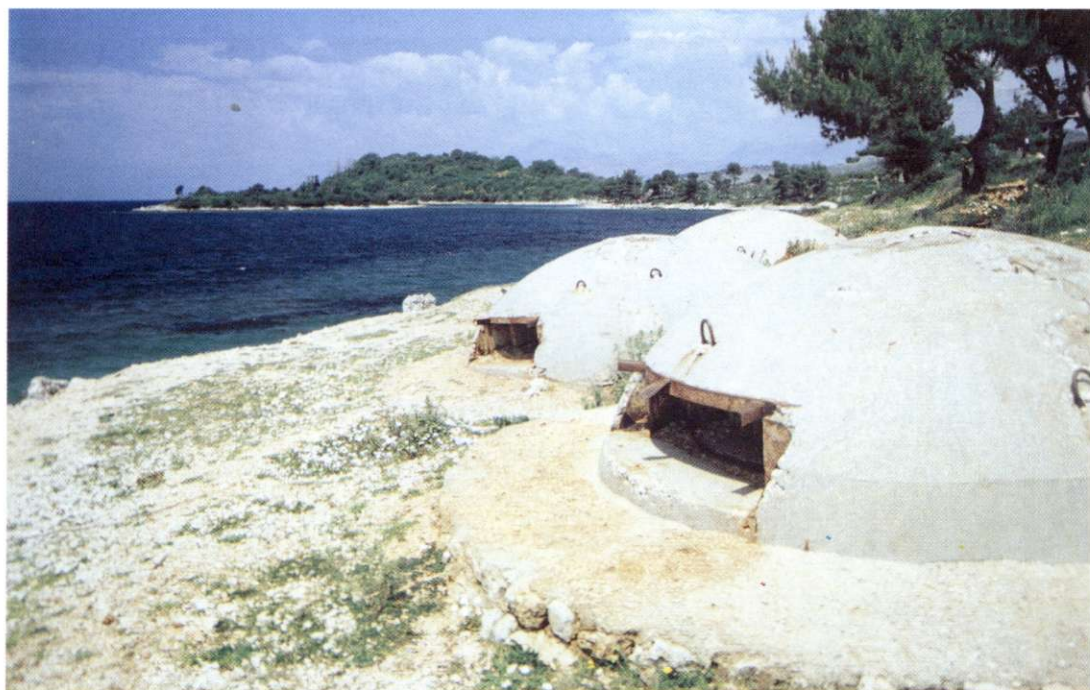
Slika 7: Vsa Albanija je posejana z nešteti bunkerji. Izdelovali so jih v tovarni in jih potem razvažali po terenu in tam sestavljali. Zato jih najdemo le v dveh velikostih. Na sliki vidimo primerke manjše velikosti na Albanski rivieri. V tej dimenziji je zgrajena večina vseh bunkerjev.

Albansko prebivalstvo je v verskem pogledu zelo raznoliko, kar je posledica burne zgodovine. Od 14. stoletja dalje je islam začel izpodrivati krščanstvo. Ker je bilo lastništvo posesti dovoljeno le muslimanom, je že v 17. stoletju več kot polovica prebivalstva prestopila v muslimansko vero. V grobem naj bi bila današnja podoba sledeča: 65 % muslimanov, 19 % katoličanov (zlasti na severozahodu okrog Skadra) in 20 % pravoslavnikov, ki se delijo na pravoslavne Grke in vernike avtokefalne pravoslavne albanske cerkve. Med muslimani je