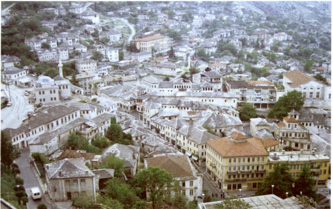
Slika 5: Gjirokastra v južni Albaniji je poleg Berata najlepše ohranjeno starodavno mesto. Zato ne preseneča, da ga je v zaščito vzel tudi UNESCO.

Pred spremembo sistema je bila večina zaposlena v primarnem sektorju (poljedelstvo in gozdarstvo, nekaj tudi ribištvo). Delež zaposlenih v primarnem sektorju se je v razdobju med letoma 1960 in 1988 zmanjšal s 55,6 % na 51,7 %. Zaradi naraščajoče industrializacije se je povečal delež industrijskega prebivalstva s 15,1 % na 22,9 %, kar je Albanijo glede stopnje industrializacije še vedno uvrščalo na rep evropskih držav. Delež zaposlenih v gradbeništvu se je v tem razdobju zmanjšal z 11,4 % na 7,0 %, v trgovini pa s 5,9 % na 4,8 %. Na drugi strani je narasel delež zaposlenih na področju prometa in komunikacij z 2,0 % na 2,9 %, v kulturi s 3,4 % na 4,5 % in v zdravstvu od 2,7 % na 2,9 %, delež zaposlenih na drugih področjih pa se je istočasno zmanjšal od 3,9 % na 3,3 % (8). O današnjem stanju ni na voljo nobenih zanesljivejših podatkov, saj se razmere iz dneva v dan spreminjajo. Z gotovostjo