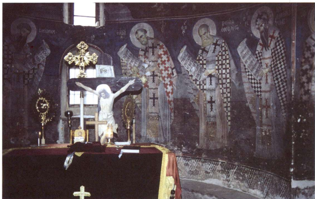
Slika 8: Velik del verskih zgradb vseh treh religij ni preživel vladavine Enverja Hoxhe. Spreminjali so jih v skladišča, športne dvorane in podobno, ali pa enostavno podrli. Pravoslavna cerkev svetega Nikolaja (Shenkolle) v odmaknjenem gorskem kraju Voskopoja je ena od redkih, kjer so stare freske preživele do današnjega dne.

Leta 1988 je kmetijstvo dajalo 31,5 % narodnega dohodka, medtem ko je bil leta 1950 ta delež kar 74,2 %. Pred vojno je bilo kmečkega prebivalstva kar 89 %! Skupno je bilo leta 1988 590 000 ha (21 %) kmetijskih zemljišč namenjeno ornim površinam, 124 000 ha (4 %) trajnim kulturam, 403 000 ha (14 %) travnikom in pašnikom, 417 000 ha pa namakalnim površinam. Kolektivizacija v kmetijstvu je bila zaključena leta 1967. Že leta 1971 so ustanovili pridelovalne zadruga "višjega tipa", pri katerih je država veliko prispevala v obliki nepovratnih sredstev in tako postala njihov solastnik.