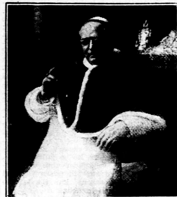
nedeljo so nameravali v Vatikanu slovesno praznovati 10letnico podpisa lateranske pogodbe ter je upal papež, da bo mogel te slavnosti še prisostvovati.

Vsebinski in cilj pontifikata Pija XI. označuje njegovo geslo: Pax Christi in regno Christi! Posebno mnogo pozornosti je posvečal vprašanju zopetne združitve rimske in pravoslavne cerkve, zlasti pa je znal zboljšati razmere med Vatikanom in Italijo. Po zaključitvi konkordata je bila 7. junija l. 1929 izvršena slovesna ratifikacija lateranske pogodbe med Vatikanom in italijansko državo, s čimer je bilo likvidirano od l. 1870 obstoječe stanje, v katerem se je smatral papež kot »jetnik italijanske krome v Vatikanu«. Tako je bilo po skoro 50 letih rešeno tako zvano »italijansko vprašanje«. Ob 50letnici posvečenja za duhovnika je papež prvič stopil na tla izven Vatikana, ki so bila priznana kot suverena last sv. stolca. Kmalu nato je prišlo do prvega obiska italijanskega kraljevskega para pri papežu. V