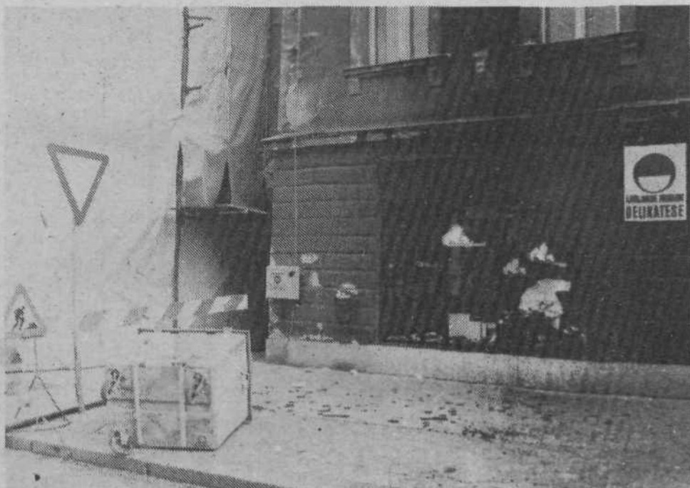
Tale prizor sicer ni posledica neuspele akcije za zeleno in čisto Ljubljano. Gre za malomarnost če že ne za neodgovorno uničevanje.