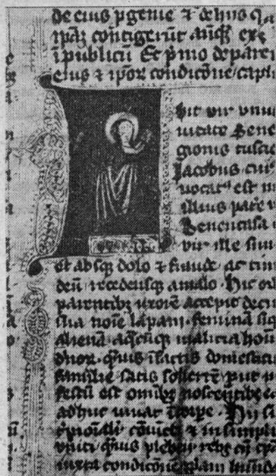
STRAN IZ ROKOPISNE KNJIGE NAPISANE V JURKLOŠTRU 1401 — V ZAČETNI ČRKI »F« JE NARISANA SV. KATARINA