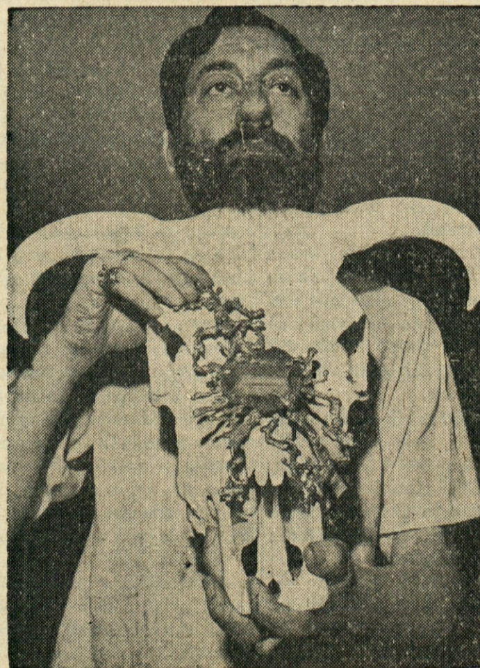
OKRASKI V IZBRANEM OKOLJU — Zlatar, draguljar in izdelovatelj raznih okraskov v Greenwich Village, N. Y., se je posvetil izdelavi prav nenavadnih okraskov. Te okraske razstavlja na poseben način, da bi vzbudil pozornost kupovalcev. Okrasek na sliki je razstavljen na beli lobanji bivola.

AMERIŠKA DOMOVINA 6117 St. Clair Ave. Cleveland 3, Ohio