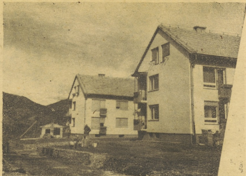
Z GRADBIŠČA V RUSAH, KJER GRADIMO MED DRUGIM TUDI VEČ STANOVANJSKIH BLOKOV

Pripomba uredništva: Uredništvo te teh nekaj pripomb hvaležno prebralo in jih sklenilo objaviti. Kot lahko vsak bralec vidi, je nekaj številke že obsežnejši. Osem strani imajo. V njej so sestavki s posameznih gradbišč. Člani uredniškega odbora si bodo prizadevali še izboljšati list, in kot je tovariš zapisal, bo to hotenje uresničljivo ob pomoči vseh. Pišite nam, dragi tovariši, sporočajte nam novice, kaj delate in kako živite.