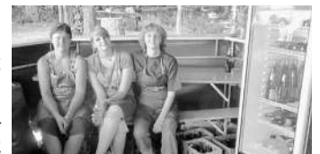
Za popolno postrežbo hrane in pijače je skrbela odlična ekipa.