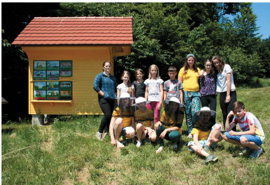
Otvoritev društveno-šolskega učnega čebelnjaka, bo v petek, 7. 8. 2015 pri čebelnjaku v Juršinci.

Leto XIX, številka 2. Avgust/veliki srpan - 2015