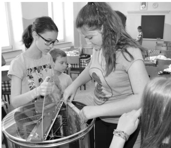
Točenje medu iz našega čebelnjaka