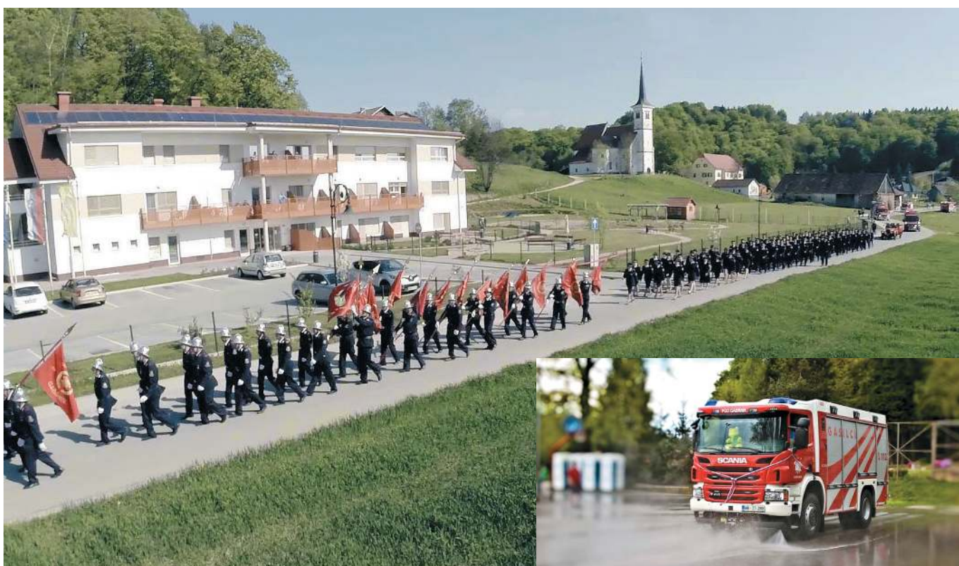
Predaja novega GASILSKEGA VOZILA AC 24/50 25. in 26. aprila 2015 pod velikim šotorom v JURŠINCIH v družbi VELIKEGA PIHALNEGA ORKESTRA iz Kopra, VESELIH ŠTAJERK in MODRIJANOV