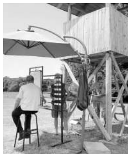
Sodniki med svojim delom