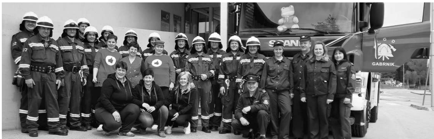
Mercatorjeva akcija »Radi delamo dobro!«

S tem pa naših uspehov še zdaleč ni bilo konec. Kot prav gotovo veste, je naše društvo aktivno tudi na humanitarnem področju, saj smo leta 2014 začeli s humanitarno akcijo »Podarimo utrip – rešimo življenje«, v kateri smo zbirali sredstva za avtomatski eksterni defibrilator (AED). Tudi ta izziv smo uspešno zaključili, saj smo v nedeljo, 7. junija, AED aparat predali svojemu namenu z namestitvijo na fasado vaško-gasilskega doma Gabrnik. Ob tej priložnosti smo organizirali tečaj iz temeljnih postopkov oživljanja ob pomoči AED aparata. K tako hitremu zaključku humanitarne akcije je prav gotovo pripomogla Mercatorjeva akcija »Radi delamo dobro!« V tej akciji, ki je letos v mesecu aprilu potekala tudi v naši Mercatorjevi trgovini v Juršincih, smo sodelovali s še dvema društvoma iz naše občine. Ker ste našemu društvu in s tem naši humanitarni akciji namenili največ žetonov, smo od trgovske hiše Mercator prejeli donacijo, ki nam je omogočila, da smo lahko tako hitro uresničili naš zastavljeni cilj. AED aparat je tako dostopen vsem 24 ur na dan.