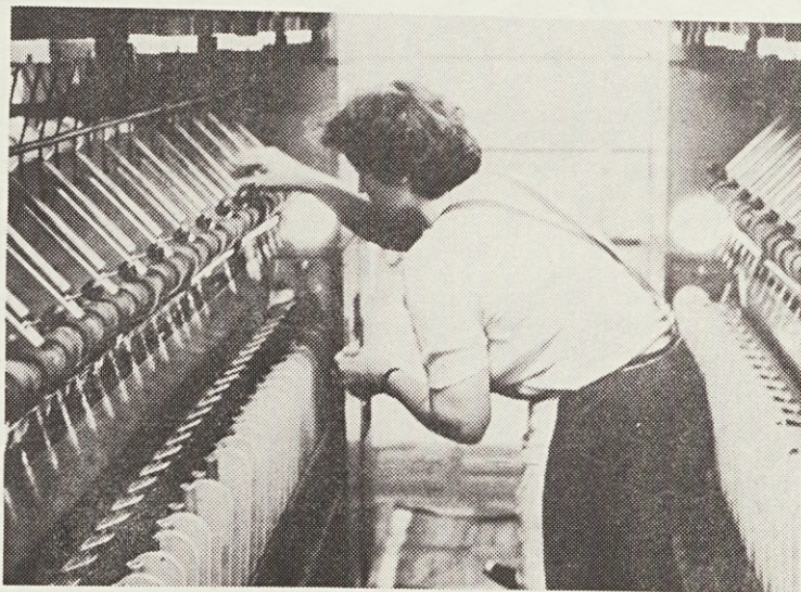
Predica v svojem značilnem, delovnem položaju.

Naj omenim le nekaj dosežkov, ki so razvidni iz spodnje razpredelnice: Proizvodnja enojne preje se je povečala za 9,25 % v primerjavi s preteklim polletjem ali za 310 ton več, ob tem, da se je znatno povečala proizvodnja sintetične in česane preje. Proizvodnja efek-