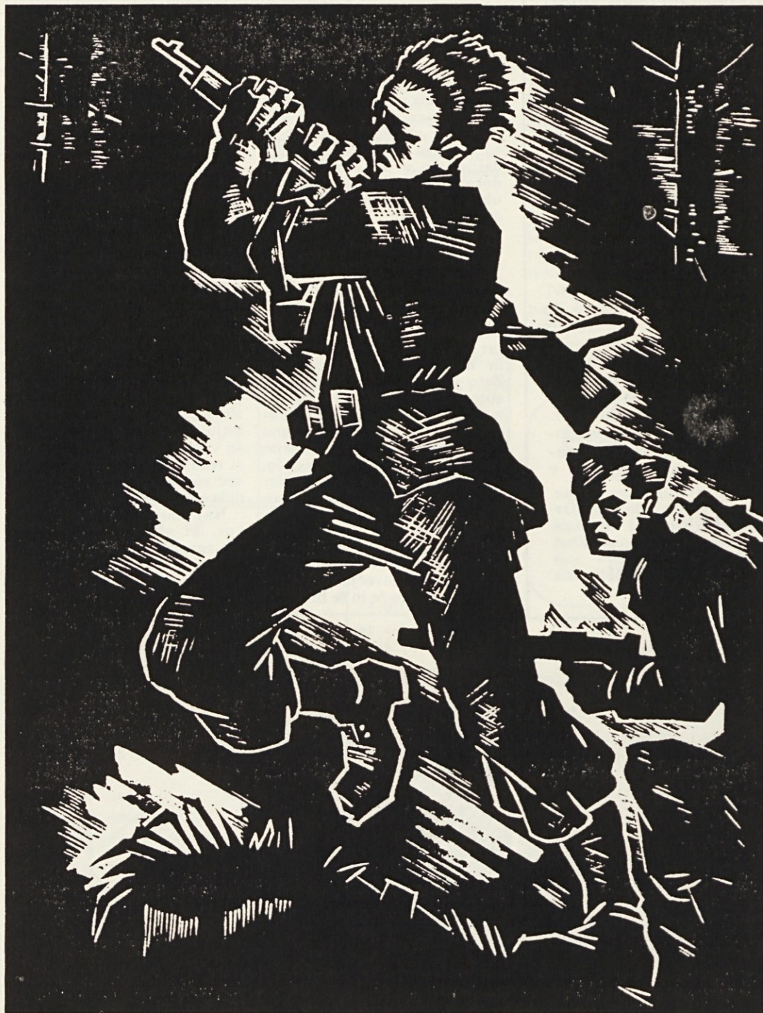
Nikolaj Pirnat: BORE SE KAKOR LEVI IZ DNEVA V DAN (1944, linorez – list iz mape »Domovi – ječe – gozdovi«)

V sklopu letošnjih jubilejev praznujemo tudi 4. julij, dan ko se je z oboroženim uporom začela rojevati naša svoboda.