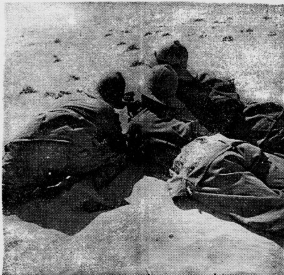
Italijanske pehotne patrole na egiptski fronti

»Če se bom že poročil, tedaj mora biti to lepo dekle in spretna kuharica obenem!« »To je vendar bigamija!«