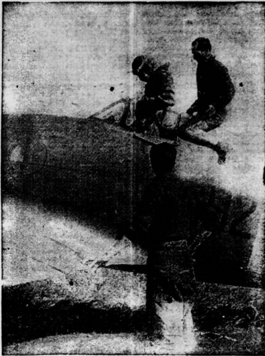
Italijanski lovci pred odletom s nekoga letališča na ruski fronti za vojno akcijo

»Novak, vstanite! Kaznovani boste z najsirožjim ukorom, zakaj včeraj sem se z vami srečal na kraju, kamor dostojen človek niti z eno nogo ne stopi!«