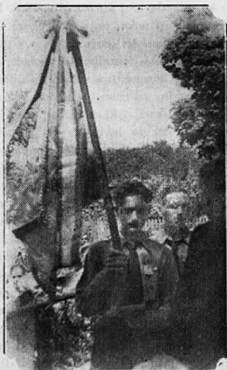
Novi prapor našega društva v Skokih