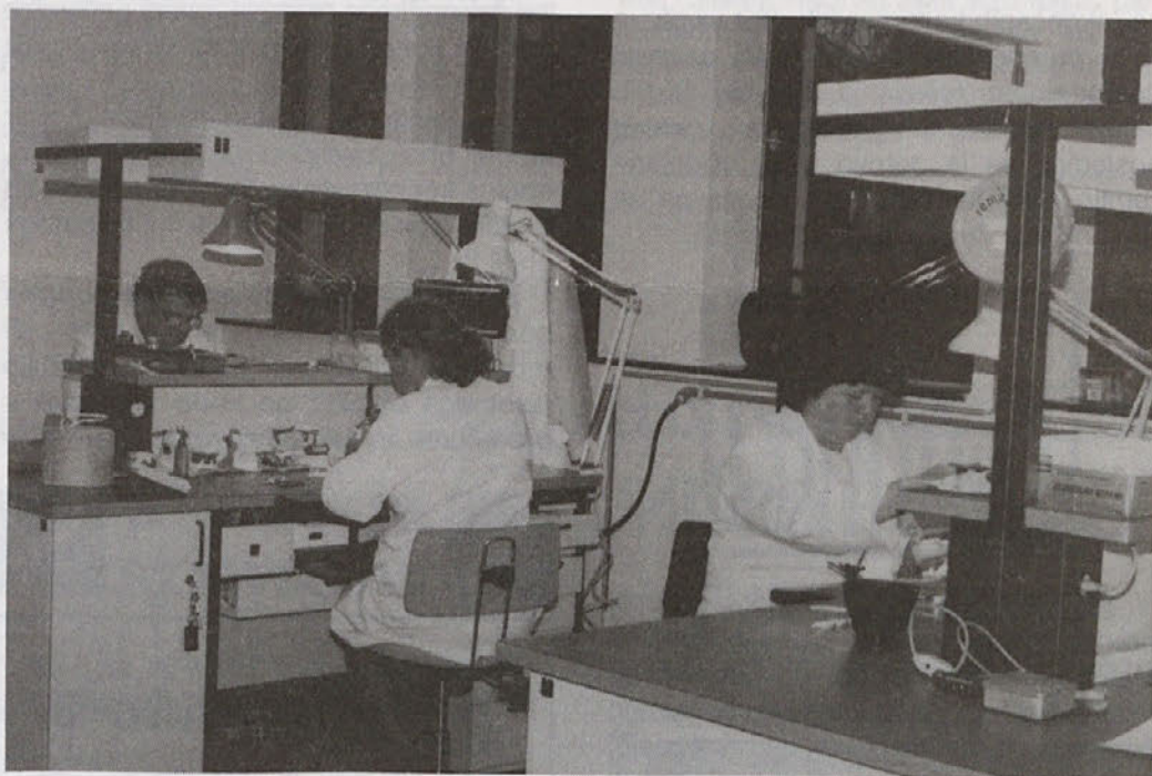
Zobozdravstveni tehniki v novih prostorih