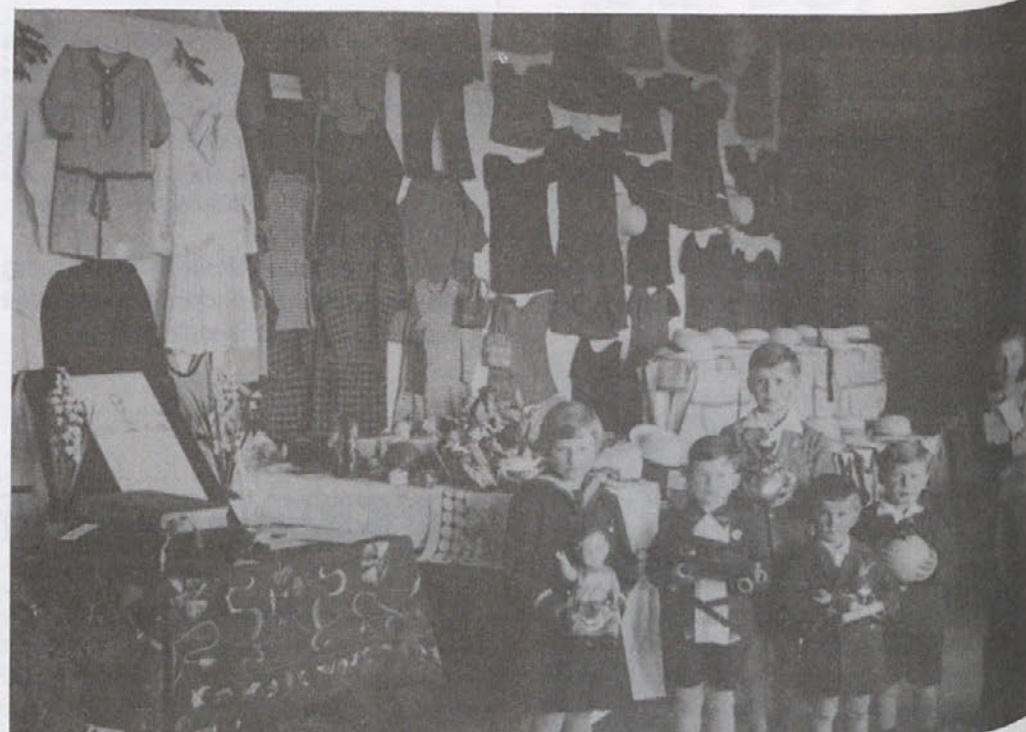
Razstavljeni izdelki gojenk

Na vprašanje, kako so takrat pri tolikem številu otrok vzdrževali disciplino,