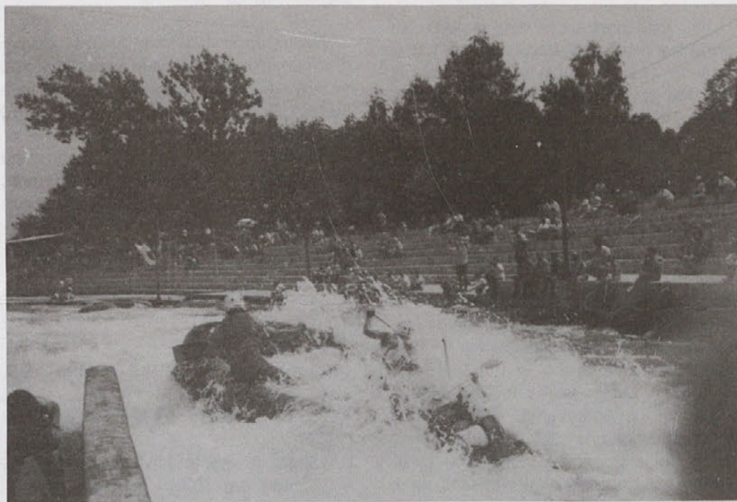
Ekipe Mrzle uode v tacenskih brzicah na tekmi za pokal Rašice

Bistriški Rafting klub vabi vse zainteresirane, da se udeležijo rafting spusta v spodnjem toku reke Reke (Vreme-Škocjanske jame). Udeležencem bodo nudili tudi uporabo celotne rafting opreme. Informacije in prijave tel. 067/81-991 ter 067/81-930.