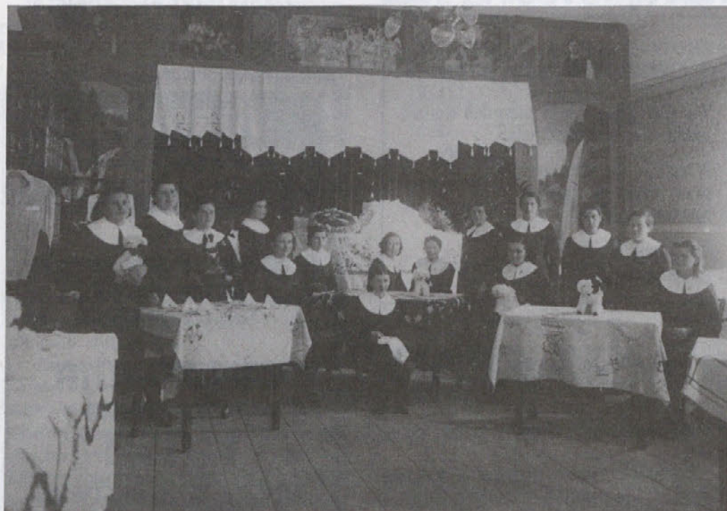
Samostanske gojenke pred "gledališkim odrom"