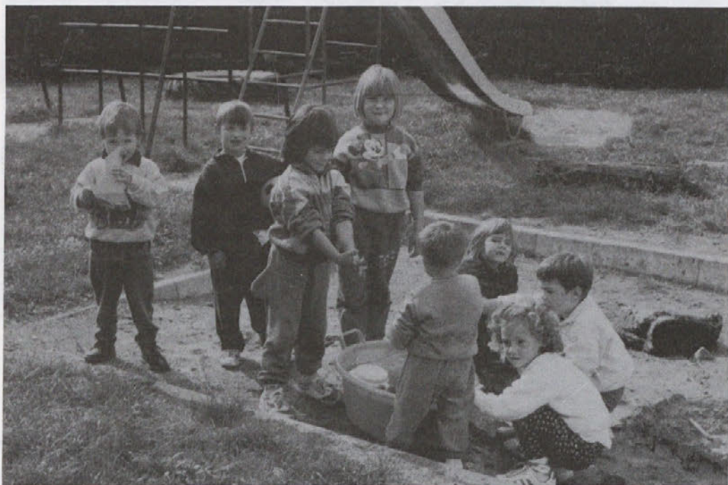
Otroci starostno mešane skupine v jelšanskem vrtcu: sredi peskovnika "škarf z vodo" - največji užitek