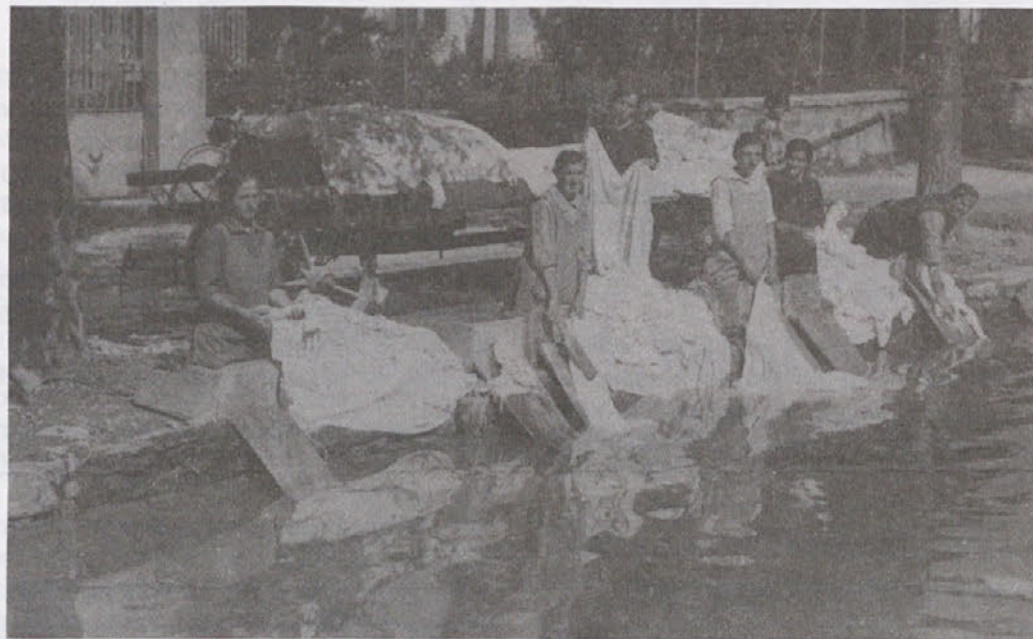
Perice iz Trnovega in samostanske kandidatke med spiranjem perila v Bistrici

Sestre so se morale v vojnem času, ko je vsega primanjkovalo, še posebej znati. Gojenci so iz ličkanja ("ker drugega ni bilo") pletli torbe, predpražnike, "šlape", copate; strojili so zajčje kožuške in jih vdevali v copate. Podirali so stare